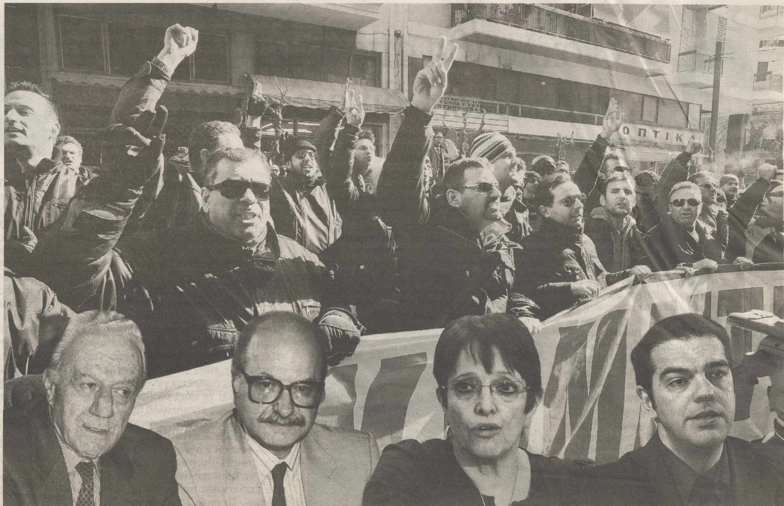
Η φωτογραφία από κινητοποίηση εργαζομένων στα μέσα μαζικής μεταφοράς και στις ένθετες (από αριστερά) ο Χαρίλαος Φλωράκης, ο Λεωνίδας Κύρκος, η Αλέκα Παπαρήγα και ο Αλέξης Τρίπρας

Δεν ήταν μόνον οι υλικές εκφάνσεις του δημόσιου χώρου (γη, χρήμα) που διεκδικήθηκαν προς ιδιοποίηση, τα ίδια έπαθαν και οι έννοιες. Η έννοια της γνώσης, για παράδειγμα, ως δημοσίως αγαθού, ως αγαθού δηλαδή από το οποίο ωφελείται όλη η κοινωνία, στρεβλώθηκε, αποστερήθηκε του κοινωνικού της περιεχομένου, ιδιωτικοποιήθηκε, κατάνησε ένα κενό γνωστικού περιεχομένου αποδεικτικό χαρτί προς ιδιωτική επαγγελματική εξαργύρωση. Η ίδια η έννοια της κοινωνίας, ο τρόπος που καταλαβαίνουμε την κοινωνία και τις συλλογικότητες γενικότερα, στρεβλώθηκε κι αυτή. Συλλογικό κατέληξε να θεωρείται το άθροισμα χιλιάδων ή εκατομμυρίων επιμέρους ατομικότητων και κοινωνικό συμφέρον το άθροισμα όλων αυτών των ατομικών συμφερόντων. Αλλά όσες ατομικότητες και αν προσθέσει κανείς, τίποτε συλλογικό δεν προκύπτει ως άθρο-