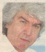
ΤΟΥ ΤΑΚΗ ΘΕΟΔΩΡΟΠΟΥΛΟΥ

Ο Μαρκ Μαζάουερ στη συνέντευξη που δημοσιεύθηκε στα «NEA» (13/10/2012), στην κρίσιμη ερώτηση παγιδεύεται από την ιδιότητα του ιστορικού. Όταν η Μικέλα Χαρτουλάρη τον ρωτάει αν πιστεύει ότι τη Χρυσή Αυγή την έφερε στο κοινωνικό προσκήνιο η αριστερή βία, εκείνος απαντάει πως όχι. Προσπαθώντας να τεκμηριώσει την άποψή του ανατρέπει στις μνήμες του Εμφυλίου του 1946-49 για να συμπεράνει, δικαιολογημένα, πως είναι