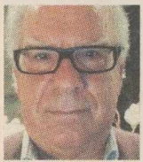
ΤΟΥ ΤΑΚΗ ΑΝΑΣΤΟΠΟΥΛΟΥ

Η επίσκεψη της γερμανίδας Καγκελαρίου σηματοδότησε την αλλαγή σελίδας στις σχέσεις Ελλάδας και ΕΕ. Σήμερα η Ελλάδα βρίσκεται σε καλύτερη θέση. Όχι ότι τα προβλήματα απομακρύνθηκαν ως διά μαγείας, η κατανόησή τους όμως θα διευκολύνει από εδώ και εμπρός την επίλυσή τους. Η προσπάθεια της χώρας να ελέγξει τα οικονομικά της και η θέλησή της να συνεχίσει σταθερά στον δρόμο των διαρθρωτικών αλλαγών έπεισε τους εταίρους μας, όπως αυτό εκφράζεται διά στόματος της κυρίας Μέρκελ