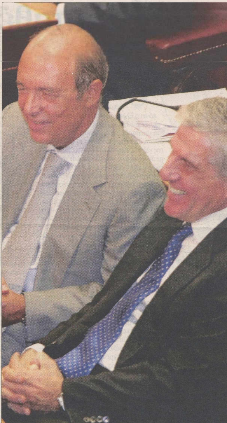
Ο πρώην πρωθυπουργός Κώστας Σημίτης με τον πρώην υπουργό Γιάννο Παπαντωνίου

μάται ως πολιτικά αναγκαία η απόδοση «πολιτικών μομφών σε αυτά». Λησμονεί όμως να αναφέρει ότι ο ίδιος ως στέλεχος τότε του ΠΑΣΟΚ με το παραπάνω σκεπτικό είχε «σταυρώσει» τον Ανδρέα Παπανδρέου για την υπόθεση Κοσκωτά.