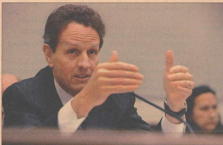
Οι προτάσεις Γκάιτνερ θα αποτελέσουν τον πυλώνα της αμερικανικής ατζέντας στη Σύνοδο Κορυφής της G20, στις 2 Απριλίου στο Λονδίνο

αποτελέσουν τον πυλώνα της αμερικανικής ατζέντας στη Σύνοδο Κορυφής της G20, στις 2 Απριλίου στο Λονδίνο, ενώ η έκκλισή του για «ευρύτερο συντονισμό σε διεθνές επίπεδο» θα είναι ιδιαίτερα αρεστή στη γαλλική και γερμανική κυβέρνηση. Όπως εξάλλου έγραψε η εφημερίδα Financial Times, πολλοί Ευρωπαίοι προτιμούν ως κυρίαρχο θέμα συζήτησης την ανάγκη για αυστηρότερη εποπτεία του χρηματοοικονομικού συστήματος από τα πιο γενναϊόδωρα δημοσιονομικά πακέτα τόνωσης των