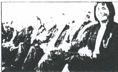
Όλα τα πρωτοκλασάτα στελέχη του ΠΑΣΟΚ ήταν στην παρουσίαση του βιβλίου του Κώστα Σημίτη.

πρωθυπουργός παρουσίασε το τρίτο έργο του χαρακτηρίζοντάς το ως τη δική του χρησιμική συνεισφορά σε αυτό που ο ίδιος αποκάλεσε «δημιουργική μνήμη». Στις σελίδες του περιλαμβάνονται όλες οι σημαντικές ομιλίες του στη Βουλή και οι δημόσιες παρεμβάσεις που έκανε καθ' όλη τη διάρκεια της πρωθυπουργίας του. Με κείμενα από το 1996, οπότε ανέλαβε τη διακυβέρνηση της χώρας, μέχρι και το 2000 περιγράφει το κλίμα των ημερών αυτών. «Η χώρα φερόταν να βρίσκεται στο χείλος της καταστροφής και η κυβέρνηση, ιδιαίτερα μετά τη Ιμια, κατηγορούσαν για υποχωρητικότητα απέναντι στην Τουρκία. Η Ελλά-