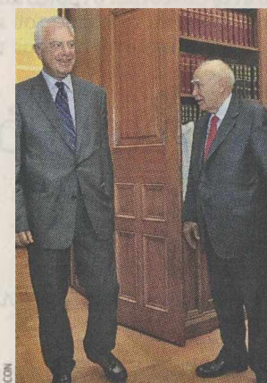
Ο κ. Παν. Πικραμμένος υπέβαλε χθες την παραίτησή του στον κ. Κάρ. Παπούλια.

Την πόρτα του Προεδρικού Μεγάρου είχε περάσει λίγο νωρίτερα ο πρωθυπουργός της υπηρεσιακής κυβέρνησης, κ. Παναγιώτης Πικραμμένος. Αφού ενημέρωσε τον κ. Παπούλια για την ομαλή διεξαγωγή των εκλογών, παρά τη δυσμενή συγκυρία που προέκυψε από τις πυρκαγιές στην Αττική, υπέβαλε στον Πρόεδρο της Δημοκρατίας την παραίτηση της κυβερνήσεώς. Όπως δήλωσε προς τον κ. Παπούλια, «η εντολή που είχατε δώσει σε αυτή την κυβέρνηση, βάσει των συνταγματικών διατάξεων, έχει ήδη εξαντληθεί».