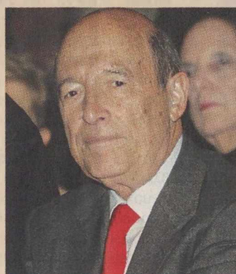
«Χρησιάζεται ουσιαστική συνεννόηση και όχι προσποίηση», δήλωσε ο πρώην πρωθυπουργός.

Πρότρυση προς τα κόμματα που υποστηρίζουν την ευρωπαϊκή προοπτική της χώρας να αρθούν στο ύψος των περιστάσεων και να λειτουργήσουν με θάρρος και μακριά από τακτικισμούς και μικροπολιτικές λογικές, προκειμένου να απαντήσουν πειστικά στις τεράστιες προκλήσεις που αντιμετωπίζει η χώρα, απηύθυνε χθες ο πρώην πρωθυπουργός Κώστας Σημίτης. Σε μία από τις σπάνιες δημόσιες παρεμβάσεις του, ο κ. Σημίτης ουσιαστικά περιγράφει ως μονόδρομο, μετά το εκλογικό αποτέλεσμα, τη συνεργασία αυτών των κομμάτων, κρούοντας τον κώδωνα του κινδύνου για το ενδεχόμενο επιστροφής της χώρας στη δραχμή. Αφήνει, ωστόσο, να εννοηθεί ότι η επιτυχία ενός τέτοιου εγχειρήματος, που θα επιτρέψει στη χώρα να σταθεί στο πόδι της ξανά, έχει προϋπόθεση την αποκατάσταση κλίματος εμπιστοσύνης.