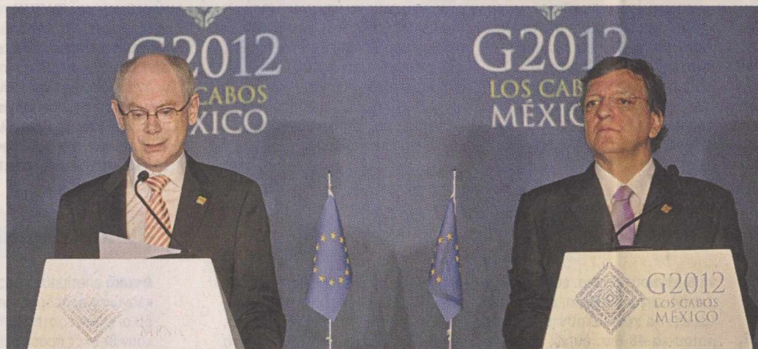
Οι πρόεδροι της Κομισιόν Ζοζέ Μανουέλ Μπαρόζο και του Ευρωπαϊκού Συμβουλίου Χέρμαν βαν Ρομπέι αναφέρθηκαν χθες στην κοινή συνέντευξη Τύπου, στο Μεξικό, στα συνταγματικά κωλύματα που αντιμετωπίζουν «ορισμένες χώρες» για το θέμα των ευρωομολόγων.

Σε κάθε περίπτωση, το βέβαιο είναι ότι οι πιέσεις στα ισπανικά και ιταλικά επίδοξα δεν εκτονώθηκαν μετά την αναμέτρηση στην Αθήνα. Εξ ου και όπως πληροφορείται η «Κ», αυτή τη στιγμή συζητούνται τρία σενάρια για τη βραχυπρόθεσμη αντιμετώπιση της κρίσης. Αυτά είναι τα εξής (σε σειρά «προτίμησης» και πιθανότητας να υλοποιηθούν): Πρώτον, η μείωση των επιτοκίων από την ΕΚΤ, τα οποία αυτή τη στιγμή βρίσκονται στο 1%. Δεύτερον, η δυναμική παρέμβαση της ΕΚΤ στην αγορά ομολόγων. Τρίτον, η τραπεζική ένωσή και η κοινή εγγύηση των καταθέσεων (και πάλι από την ΕΚΤ). Και στις τρεις προοπτικές -κυρίως