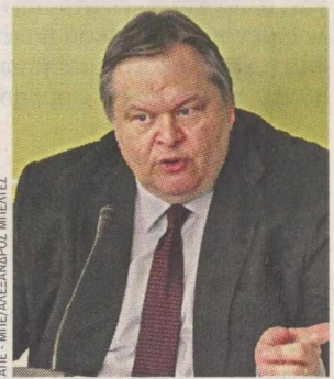
Ο κ. Βενιζέλος εμμένει στη θέση υπέρ της κυβέρνησης εθνικής συσκευασίας.

Συμφωνία για σχηματισμό κυβέρνησης το αργότερο μέχρι σήμερα το βράδυ επιθυμεί ο κ. Ευ. Βενιζέλος. Ο πρόεδρος του ΠΑΣΟΚ συμφώνησε χθες το απόγευμα με τον κ. Α. Σαμαρά, σε μια συνάντηση που έγινε σε εξαιρετικό κλίμα, να μην παραλάβει τη διερευνητική εντολή (όπως θα κάνει πριν από αυτόν και ο κ. Αλ. Τσίπρας), προκειμένου να συγκληθεί άμεσα, υπό την προεδρία του Προέδρου της Δημοκρατίας, συμβούλιο των τεσσάρων πολιτικών αρχηγών (Ν.Δ., ΣΥΡΙΖΑ, ΠΑΣΟΚ, ΔΗΜΑΡ). Ο κ. Βενιζέλος εμμένει μεν στην τακτική της κυβέρνησης εθνικής ενότητας με τη συμμετοχή και του ΣΥΡΙΖΑ, αντιλαμβάνεται δε ότι κάτι τέτοιο είναι εξαιρετικά δύσκολο να συμβεί μετά και τις τελευταίες δηλώσεις του κ. Αλ. Τσίπρα. Μάλιστα χθες, μετά τη συνάντησή με τον κ. Σαμαρά, τόνισε ότι το εκλογικό αποτέλεσμα υπέδειξε τρεις κατευθύνσεις: «Πρώτον, την παραμονή της χώρας στο ευρώ, δεύτερον, τη διατήρηση των κεκτημένων της δανειακής σύμβασης και την αναθεώρηση των όρων και, τρίτον, ο ελληνικός λαός έδωσε εντολή συνεργασίας και συστράτευσης». Ο κ. Βενιζέλος τόνισε ότι όλα τα παραπάνω συνιστούν προτεραιότητα έναντι των προσώπων που θα επιλεγούν για να στελεχώσουν την κυβέρνηση.