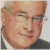
ΤΟΥ Ι. Κ. ΠΡΕΤΕΡΤΕΡΗ