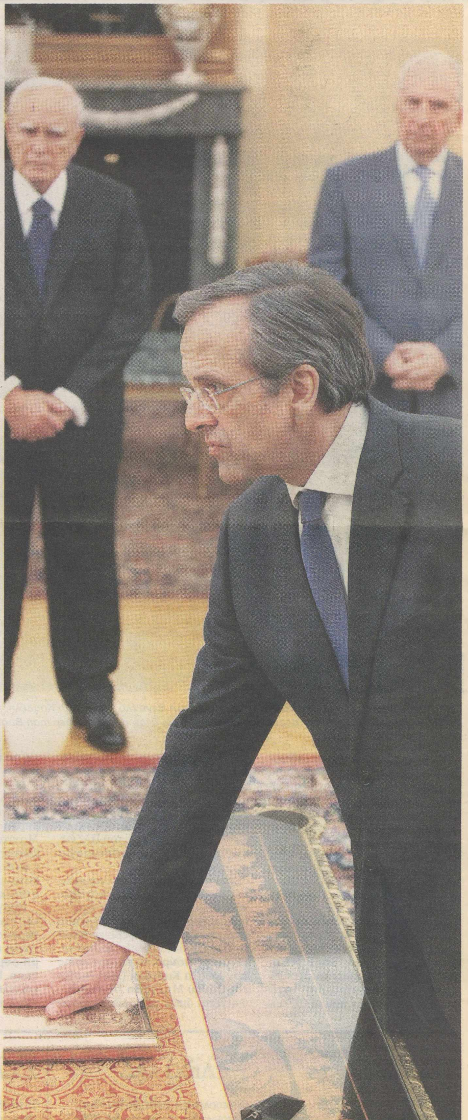
Ο Αντώνης Σαμαράς ορκίζεται Πρωθυπουργός υπό το βλέμμα του Κάρου Παπούλια. Δίπλα στον Πρόεδρο, όπως ορίζει το πρωτόκολλο, ο γενικός γραμματέας της Προεδρίας της Δημοκρατίας Κωνσταντίνος Γεωργίου

Ο συγκάτοικός του στο Κολέγιο Αμχερσι στην Αμερική Γιώργος Παπανδρέου διηγούνταν κάποτε ότι τον θυμόταν στο δωμάτιό τους να κάνει πρόβες πολιτικού ρήτορα. Προτού συμπληρώσει τα 26 του χρόνια έγινε ο νεότερος βουλευτής στην ιστορία του ελληνικού Κοινοβουλίου, το 1977