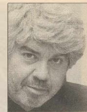
Του ΤΑΚΗ ΘΕΟΔΩΡΟΠΟΥΛΟΥ

όλα. Περνούν. Το λέει η λαϊκή σοφία. Το επαναλαμβάνει ο τίτλος του μυθιστορήματος του Βασίλι Γκρόσμαν, συγγραφέα της συντακτικής σύνθεσης «Ζωή και πεπρωμένο». Ετσι, λοιπόν, «κι αυτό θα περάσει.»