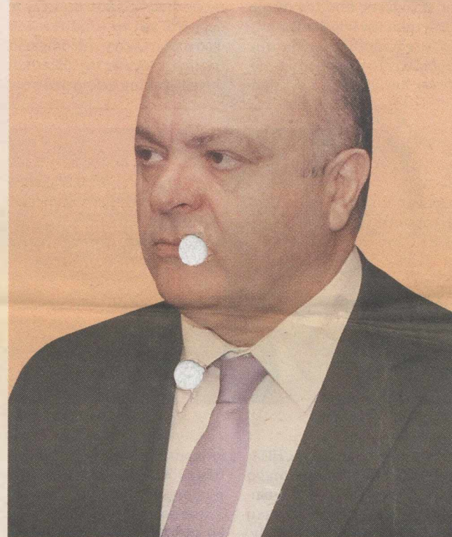
Ο υπουργός Οικονομικών, Γ. Ζασιάς, γνωρίζει ότι η παρατεταμένη προεκλογική περίοδος έχει «παγώσει» το φοροεισπρακτικό μηχανισμό, όπως δείχνουν τα μέχρι τώρα στοιχεία.

σσότεροι από 2 εκατ. φορολογούμενοι, οι οποίοι κατείχαν την 1η Ιανουαρίου 2011 κτίσματα και εντός σχεδίων πόλεων οικόπεδα των οποίων η αντικειμενική αξία ξεπερνά το αφορολόγητο όριο των 400.000 ευρώ.