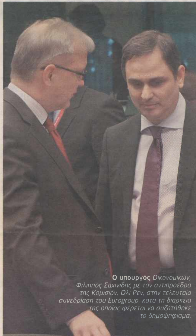
Ο υπουργός Οικονομικών, Φίλιππος Σαχινίδης με τον αντιπρόεδρο της Κομισιόν, Ολι Ρεν, στην τελευταία συνεδρίαση του Eurogroup, κατά τη διάρκεια της οποίας φέρεται να συζητήθηκε το δημοψήφισμα.

Την ίδια στιγμή, ο Επίτροπος της Ε.Ε. για την Ενέργεια, Γκούντερ Ετινγκερ, δήλωσε ότι οι ελληνικές εκλογές του Ιουνίου αποτελούν δημοψήφισμα για το ευρώ εκφράζοντας παράλληλα τη βεβαιότητα ότι η Ελλάδα δεν επιθυμεί να αποχωρήσει από την Ευρωζώνη. Σε συνέντευξή του στην εφημερίδα Die Welt, ο κ. Ετινγκερ σημειώνει ότι είναι πιθανό η νέα κυβέρνηση στην Αθήνα - ανεξαρτήτως της σύνθεσής της - να αναγνωρίσει την αναγκαιότητα να συνεχιστεί το πρόγραμμα λιτότητας. Προέβλεψε ότι σε δέκα χρόνια από σήμερα, όλες οι χώρες της Ε.Ε. θα έχουν