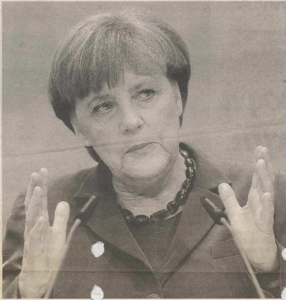
ΤΟ ΘΕΜΑ της Ελλάδας, λόγω της άρρηκτης σχέσης του με το ευρώ, έχει πρώτη προτεραιότητα στην ατζέντα της Ανγκελα Μέρκελ, επισημαίνει συνεργάτης της

λίζει την παραμονή της Ελλάδας στην ευρωζώνη υπό τις συνθήκες του μνημονίου, έχει τουλάχιστον ένα μεγάλο καλό: διαψεύδει τις φήμες για την ύπαρξη γερμανικού ή άλλου διεθνούς σχεδίου εκδίωξης της Ελλάδας από την ευρωζώνη. «Δεν υπάρχει τέτοιο σχέδιο» διαβεβαιώνει στενός σύμβουλος της καγκελάριας που θέλει να μείνει ανώνυμος. «Ούτε υπήρξε ποτέ».