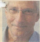
ΤΟΥ ΘΑΝΑΣΗ ΔΙΑΜΑΝΤΟΠΟΥΛΟΥ

Είναι προφανές πως το νέο προεκλογικό τοπίο είναι ριζικά διάφορο με αυτό που υπήρχε προ της 6ης Μαΐου, αφού η εκκωφαντική λαϊκή ετυμηγορία άλλαξε και ακύρωσε όλα τα προϋπάρχοντα δεδομένα της δημόσιας ζωής του τόπου (π.χ. συσχετισμούς δύναμης, πολιτικό λόγο, εκλογικές στοχεύσεις και κοινωνική εικόνα των κομμάτων). Εξάλλου ο Μπεράν το υπερτόνιζε: «Προ των εκλογών και μετά τις εκλογές μεσο-λαβεί ένα καθοριστικό γεγονός που αλλάζει τα πάντα: οι εκλογές»... Τι προοπτικές όμως έχουν για πρόσθετες εισροές ή εκροές ψηφοφόρων, ενόψει της επαναληπτικής εκλογικής ανα-