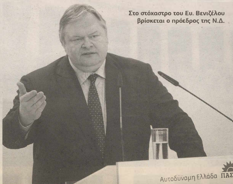
Στο στόχαστρο του Ευ. Βενιζέλου βρίσκεται ο πρόεδρος της Ν.Δ.

Μ ε πόλωση του προεκλογικού κλίματος απαντά το ΠΑΣΟΚ στην τακτική της Νέας Δημοκρατίας αλλά και των κομμάτων της Αριστεράς ανεβάζοντας απότομα τους τόνους, προκειμένου να ξεκολλήσει από τη θέση που του έδιναν μέχρι την περασμένη Παρασκευή όλες οι δημοσκοπήσεις. Ο πρόεδρος του ΠΑΣΟΚ Ευ. Βενιζέλος μιλώντας σε Ηράκλειο, Λαμία, Κοζάνη και Ιωάννινα από την Παρασκευή μέχρι χθες το βράδυ κλιμάκωσε τις επιθέσεις εναντίον του προέδρου της Ν.Δ. Α. Σαμαρά αλλά και κατά του ΚΚΕ, του ΣΥΡΙΖΑ και της Δημοκρατικής Αριστεράς. Ο πρόεδρος του ΠΑΣΟΚ προκειμένου να αντιμετωπίσει τις διαρροές των ψηφοφόρων του ΠΑΣΟΚ προς άλλες κατευθύνσεις και να ανεβάσει τη χαμηλή συσπείρωση του κόμματός του: