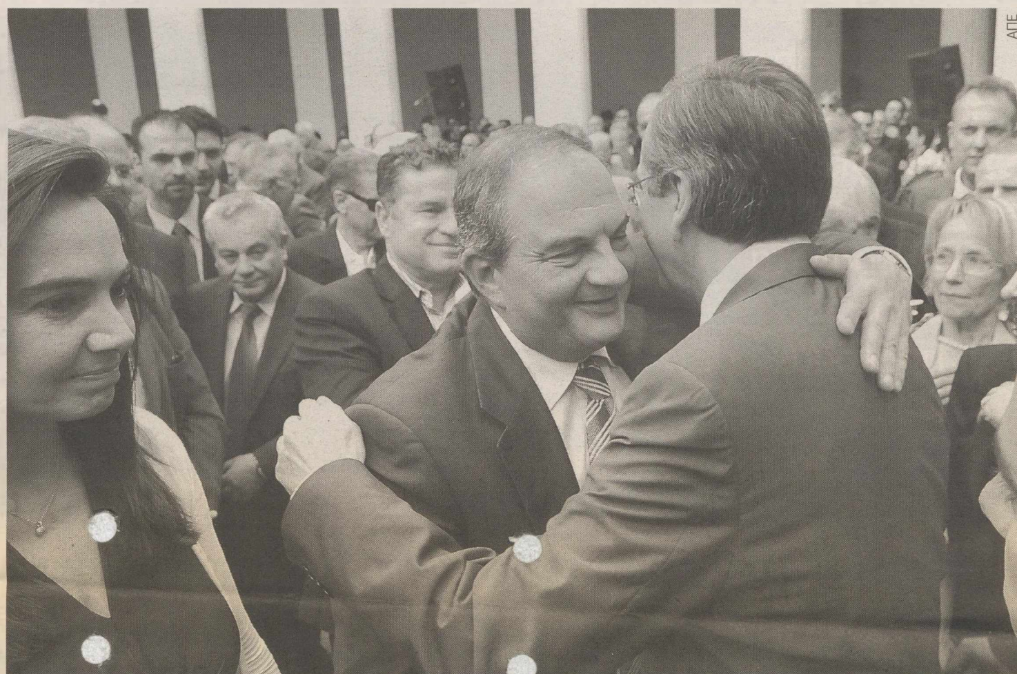
Θερμός εναγκαλισμός εν μέσω χειροκροτημάτων με τον Κώστα Καραμανλή.

► Δεν μπορεί η δόση των δανείων να ξεπερνά το 30% από το μηνιαίο εισόδημά τους χωρίς να τεθεί σε κίνδυνο το τραπεζικό σύστημα. Η πρόβλεψη προβλέπει να νομοθετηθεί ρύθμιση για όσους έχουν τέτοιο πρόβλημα, να πληρώνουν μόνο