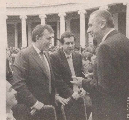
Ενθουσίασε το σχέδιο για έξοδο από την κρίση.

► Πρόβλεψη για τα δάνεια: το 70% της αγροτικής γης είναι υποθηκευμένη στην Αγροτική Τράπεζα που έχει πια μεγάλο πρόβλημα. «Αυτό το πρόβλημα χρειάζεται ειδική αντιμετώπιση. Και μαζί να διευκολυνθούν οι αγρότες στην αποπληρωμή των δανείων τους. Μπορεί να γίνει. Τη ρευστότητα που θα εξασφαλίσουμε για τους μικρομεσαίους επιχειρηματίες θα την επεκτείνουμε και στους αγρότες, διευκολύνοντας τη δανειοδότησή τους. Προτεραιότητά μας το αγροτικό ΤΕ-ΜΠΜΕ που εξαγλήθηκε αλλά ποτέ δεν υλοποιήθηκε».