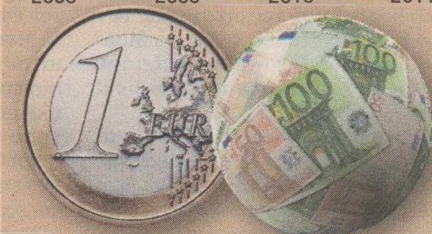
Όλα τα μεγέθη σε δισ. ευρώ και σε όρους γενικής κυβέρνησης