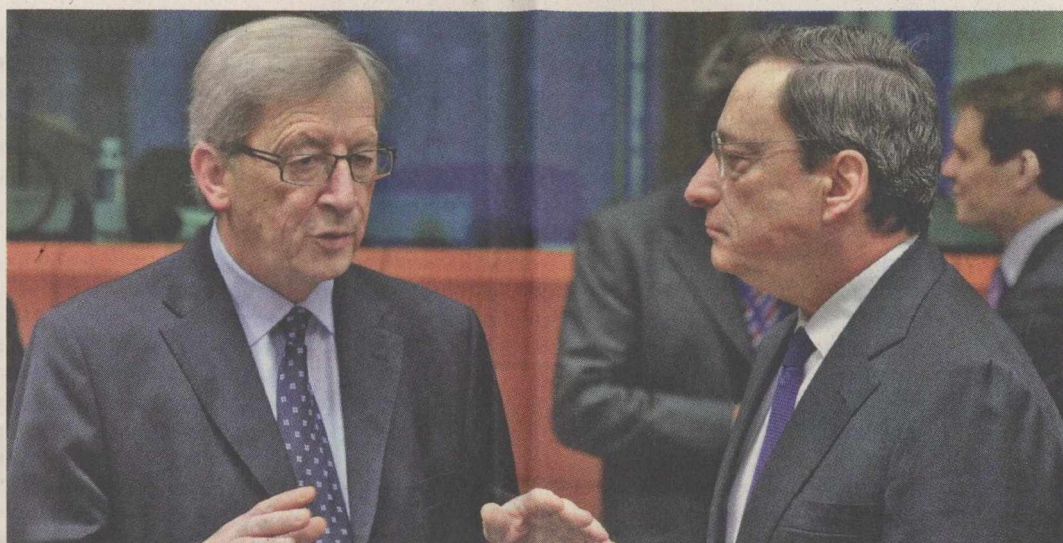
Ο πρόεδρος του Eurogroup Ζαν-Κλοντ Γιουνκέρ συνομιλεί με τον Ευρωπαίο κεντρικό τραπεζίτη Μάριο Ντράγκι, στο περιθώριο της χθεσινής συνεδρίασης.

Την περασμένη Παρασκευή, οι υπουργοί Οικονομικών της Ευρωζώνης είχαν δώσει το πρώτο «πράσινο φως» εγκρίνοντας την καταβολή 35,5 δισ. ευρώ που συνδέονται με την ολοκλήρωση της εθελοντικής αναδιάρθρωσης του ελληνικού χρέους που κατέχουν ιδιώτες. Σύμφωνα με αξιωματικό της Επιτροπής μέχρι τις 20 Μαρτίου θα πρέπει να έχουν δοθεί στην Ελλάδα 5 δισ. ευρώ, τα οποία θα χρησιμοποιηθούν για την εξυπηρέτηση ομολόγου ύψους 4,6 δισ. ευρώ που λήγει εκείνη την ημερομηνία. Το διοικητικό συμβούλιο του Διεθνούς Νομισματικού Ταμείου θα συνεδριάσει την Πέμπτη, προκειμένου να εγκριθεί η χορήγηση του δεύτερου πακέτου βοήθειας προς την Ελλάδα ύψους 28 δισ. ευρώ.