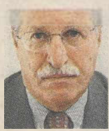
ΤΟΥ Π.Κ. ΙΩΑΚΕΙΜΙΔΗ

Μ α τι γίνεται τέλος πάντων, η Ευρώπη δεν έχει να ασχοληθεί με τίποτα άλλο παρά να «εκβιάζει» συνεχώς την Ελλάδα; Γιατί ακούγοντας κάποια βραδινά δελτία ειδήσεων και διαβάζοντας ορισμένα έντυπα ευκόλως διαμορφώνεις την άποψη ότι η ΕΕ και οι χώρες που τη συγκροτούν (με επικεφαλής τη Γερμανία βεβαίως) δεν κάνουν τίποτα άλλο παρά να σχεδιάζουν «εκβιασμούς» σε βάρος της χώρας.