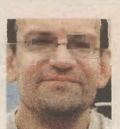
ΤΟΥ ΗΛΙΑ ΚΑΝΕΛΛΗ

Η Ελλάδα είναι τα μάρμαρα. Κλισέ ή όχι, το χρησιμοποιούν εξίσου το ΠΑΜΕ (που κρεμάει κάθε τόσο τα ωραία πανό του στην Ακρόπολη) όσο και οι γελοιογράφοι όλου του κόσμου. Το χρησιμοποιούν και οι αδελφοί Αδωνίς και Λεωνίδας Γεωργιάδης και ο Ντανιέλ Κον-Μπεντίτ. Με άλλα λόγια, έστω και από διαφορετική οπτική γωνία, η σημερινή Ελλάδα υποκαθιστά το έλλειμμα