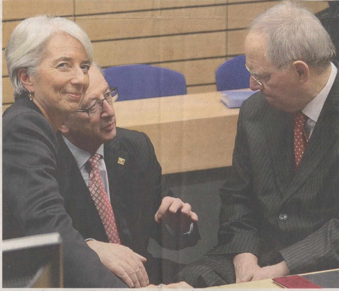
Η επικεφαλής του ΔΝΤ Κριστίν Λαγκάρντ συνομιλεί με τον πρόεδρο του Eurogroup Ζαν-Κλοντ Γιουνκέρ και τον Γερμανό υπουργό Οικονομικών Βόλφγκανγκ Σόιμπλε.