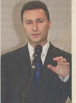
Ο πρωθυπουργός της ΠΓΔΜ, κ. Νικόλα Γκρούεφσκι.

Οι συνθήκες, πάντως, δεν αφήνουν πολλά περιθώρια αισιοδοξίας ότι μπορεί να αναμένεται ουσιαστική πρόοδος στη διαπραγμάτευση για το όνομα. Η πολιτική ηγεσία των Σκοπίων, όπως έδειξε η πρόσφατη επίσκεψη του ειδικού διαπραγματευτή του ΟΗΕ, Μάθιου Νίμιτς, επέλεξε να οχυρωθεί πίσω από την απόφαση του Διεθνούς Δικαστηρίου της Χάγης, την οποία επικαλείται σε κάθε ευκαιρία ως δικαίωση των θέσεων και της στάσης της. Στο εσωτερικό, δε, εξακολουθεί να καλλιεργεί κλίμα αλυτρωτισμού.