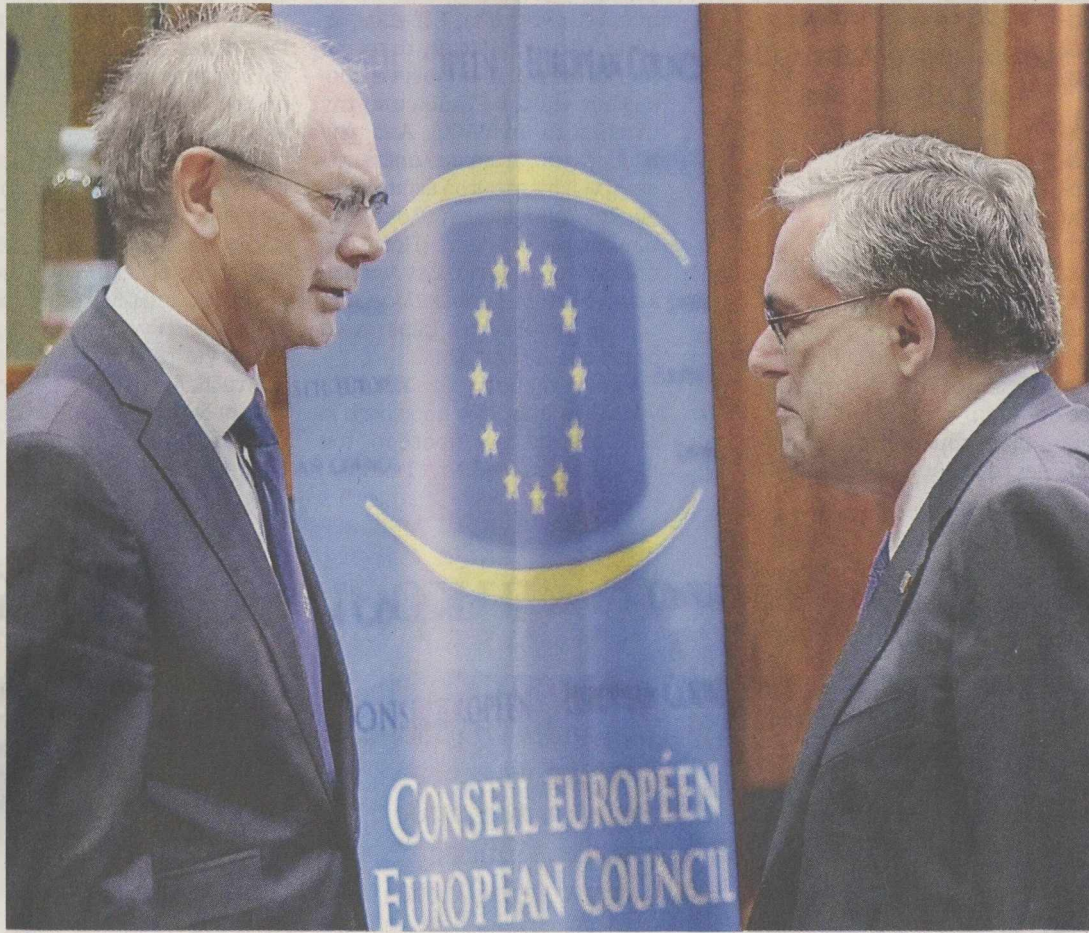
Ο Έλληνας πρωθυπουργός Λουκάς Παπαδήμος με τον πρόεδρο του Ευρωπαϊκού Κοινοβουλίου Χέρμαν Βαν Ρομπέι στο περιθώριο της κθεσινής συνόδου κορυφής, στις Βρυξέλλες.