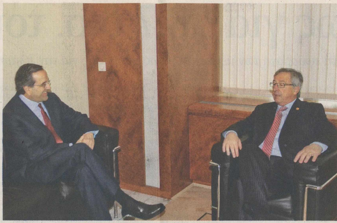
Ο κ. Γιουνκέρ κατά τη συνάντηση που είχε με τον κ. Αντ. Σαμαρά φέρεται να είπε στον πρόεδρο της Ν.Δ.: «Πήρατε μία πολύ γενναία απόφαση. Πρέπει όλη η Ευρώπη να καταλάβει ότι η Ελλάδα πάσχει πάρα πολύ».

Τη μακρά περίοδο των «παγωμένων σχέσεων», αλλά και την αλλαγή του κλίματος μετά τη στήριξη της κυβέρνησης Παπαδήμου από τη Ν.Δ. και την υπερψήφιση της νέας δανειακής σύμβασης, μνημόνευσε η ίδια η κ. Μέρκελ, η οποία, στην έναρξη της συνάντησής με τον κ. Σαμαρά σημείωσε ότι όταν υπογράφηκε το πρώτο Μνημόνιο, υπήρχε «μία ένταση στην ατμόσφαιρα, η οποία σήμερα δεν υπάρχει». Ο κ. Σα-