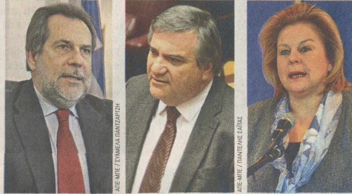
Ος εγγυητής ενός «ανοικτού και πολυσυλλεκτικού ΠΑΣΟΚ» εμφανίστηκε χθες ο κ. Χρ. Παπουτσή. Οι κ.κ. Χ. Καστανιδής και Λούκα Κατσέλη συμψήφισαν στην ιδεολογική πλατφόρμα του νέου τους κόμματος.

Εμφανιζόμενος ως εγγυητής ενός «ανοικτού και πολυσυλλεκτικού ΠΑΣΟΚ» και όχι ενός κόμματος «καθαρού και μικρού», ο κ. Χρ. Παπουτσή ανακοίνωσε και επισήμως χθες την υποψηφιότητά του για την ηγεσία του κόμματός του. Σε συνέντευξη Τύπου που παραχώρησε, δήλωσε ότι κεντρικός στόχος του είναι η ανατροπή «της αδιέξοδης και νεοφιλελεύθερης πολιτικής της Ε.Ε.», αλλά απέφυγε να μπει σε λεπτομέρειες για το αν διαφωνούσε και με ποιες από τις επιλογές της κυβέρνησης στην οποία ανήκε μέχρι πρότινος. Αναλόγως επιφυλάχθηκε να αποσαφηνίσει τις ιδεολογικές διαφορές του με τον κ. Ευ. Βενιζέλο, αφού ακούσει τη σχετική διακήρυξη του αντιπάλου του, ενώ για τους προσφάτως διαγραφμένους βουλευτές είπε ότι ήταν λάθος η ποινικοποίηση της αγωνίας τους, αλλά αιτιολόγησε την επιλογή του κ. Παπανδρέου να τους διαγράψει.