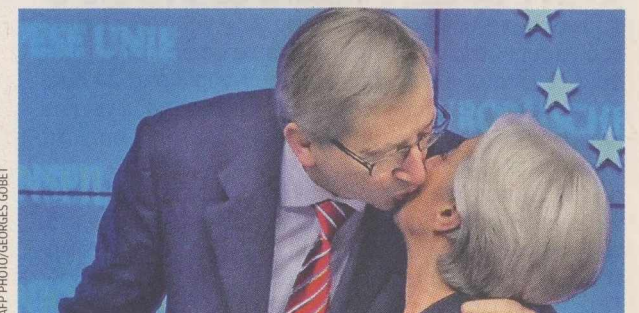
Το φιλί του προέδρου του Eurogroup κ. Ζαν-Κλοντ Γιουνκέρ στην επικεφαλής του ΔΝΤ κ. Κριστίν Λαγκάρντ, από τα πλέον χαρακτηριστικά σημεία της συνεδρίασης.

Πάντως, ακόμα και μετά τη συμφωνία του ιδιωτικού τομέα σε όλα όσα ζητούσαν οι εταιρείες και αφού η ελληνική πλευρά είχε αποδεχτεί δύσκολους όρους, όπως η νομοθετική κατοχύρωση ότι θα αποπληρώνει τα κρέπη της και η δημιουργία του ειδικού λογαριασμού και με τη συμμετοχή ελληνικών φορολογικών εσόδων, υπήρχε τα ζημειώματα ακόμα ένα χρηματοδοτικό κενό. Εκεί όμως οι Γερμανοί και κυρίως οι Ολλανδοί, διατηρώνοντας την αποφασιστικότητά τους να βρεθεί λύση, πίεσαν την ΕΚΤ να μοιράσει τα κέρδη της από τα ελληνικά ομόλογα στα κράτη και αυτά να χρησιμοποιηθούν για τη μείωση του ελληνικού χρέους. Με τη διαφορά στο 0,5%, όλοι έκριναν ότι ο στόχος είχε επιτευχθεί.