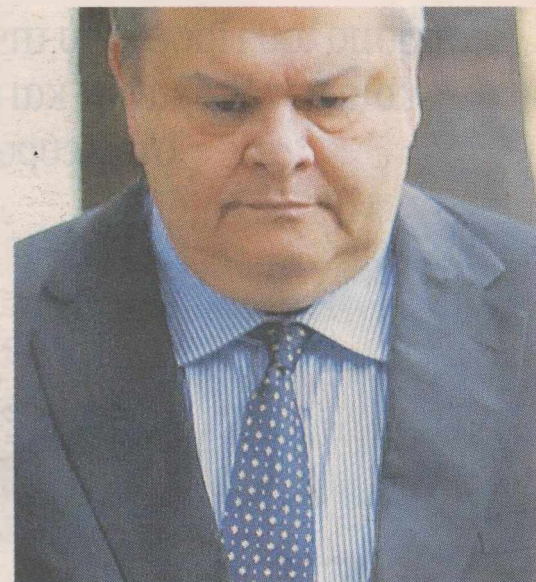
Ο υπουργός Οικονομικών αποχωρεί από το Προεδρικό Μέγαρο μετά τη χθεσινή του συνάντηση με τον Κάρλο Παπούλια

ΜΕ ΤΟΥΣ ΑΡΧΗΓΟΥΣ. Ο κ. Βενιζέλος ενημέρωσε αργά το βράδυ τον Πρωθυπουργό για τις εξελίξεις, ενώ τις επόμενες ώρες έχει ζητήσει να συναντηθεί με πολιτικούς αρχηγούς. Ηδη έχουν κλειστεί συναντήσεις με τον Γιώργο Καρατζαφέρη (σήμερα το απόγευμα) και με τον Φώτη Κουβέλη για αύριο. Παράλληλα, όπως έγινε γνωστό, ως την Κυριακή θα συνεδριάσει το Υπουργικό Συμβούλιο, το οποίο και θα σταθμίσει τα νέα δεδομένα μετά το χθεσινό Eurogroup. Οι υπουργοί Οικονομικών της ευρωζώνης δεν παύουν να πιέζουν από τις διαβεβαιώσεις του κ. Βενιζέλου ότι τα δύο μεγάλα κόμματα που συνεργάζονται στην κυβέρνηση Παπαδόπουλου «είναι οι δύο δυνάμεις πάνω στις οποίες μπορεί να βασιστεί ούτως ή άλλως αυτή η στιγμή η εφαρμογή του προγράμματος», ούτε από την ανάλυση που τους έκανε για τα θέματα της εθνικής κυριαρχίας.