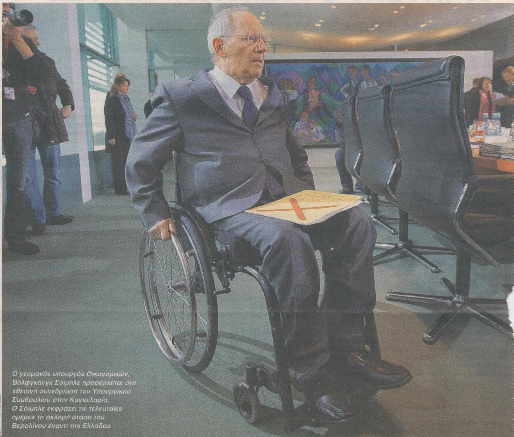
Ο γερμανός υπουργός Οικονομικών, Βόλφγκανγκ Σόιμπλε προσέρχεται στη χθεσινή συνεδρίαση του Υπουργικού Συμβουλίου στην Καγκελαρία. Ο Σόιμπλε εκφράζει τις τελευταίες ημέρες τη σκληρή στάση του Βερολίνου έναντι της Ελλάδας