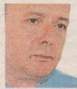
ΤΟΥ ΒΑΣΙΛΗ ΠΑΠΑΒΑΣΙΛΕΙΟΥ

Ενα κράτος που δεν έμαθε ποτέ πόσους δημοσίους υπαλλήλους μισθοδοτούσε, πόσους νεκρούς ασφαλισμένους συνταξιοδοτούσε, πόσους αόματους οδηγούς αυτοκινήτων