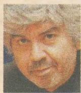
ΤΟΥ ΤΑΚΗ ΘΕΟΔΩΡΟΠΟΥΛΟΥ

Αν κατάλαβα καλά ο πρύτανης του Πανεπιστημίου Αθηνών ενήμερωσε εγγράφως την Αστυνομία για την παρουσία «εξωπανεπιστημιακών» στοιχείων στο νέο κτίριο της Νομικής Σχολής Αθηνών.