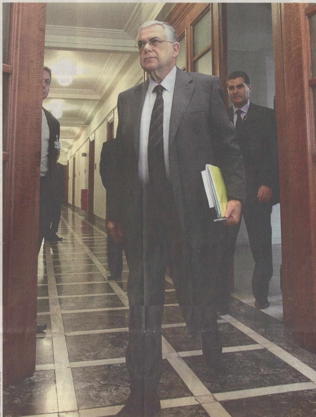
Ο πρωθυπουργός, κατά τη χθεσινή συνεδρίαση του Υπουργικού, έκανε λόγο για πολλά και κρίσιμα βήματα που πρέπει να γίνουν και ζήτησε από την κυβέρνηση να «εργαστεί πολύ σκληρά, συστηματικά και συστηματικά».

Το υπουργικό συμβούλιο ενέκρινε τα υπομνηστικά του υπουργείου Προστασίας του Πολίτη για τους ένοπλους φρουρούς στα ποινολύπια, και του υπουργείου Υγείας για την περαιτέρω περικοπή της φαρμακευτικής δαπάνης. Τέλος, ο κ. Παπαδήμος ανακοίνωσε ότι αποδέχτηκε όλες τις παρατήσεις, πλην εκείνων του Μάκη Βορίδη. Όπως ανακοίνωσε στο υπουργικό συμβούλιο, «ζητείται από τον κ. Βορίδη να παραμείνει στη θέση του ως υπουργός Υποδομών, Μεταφορών και Δικτύων».