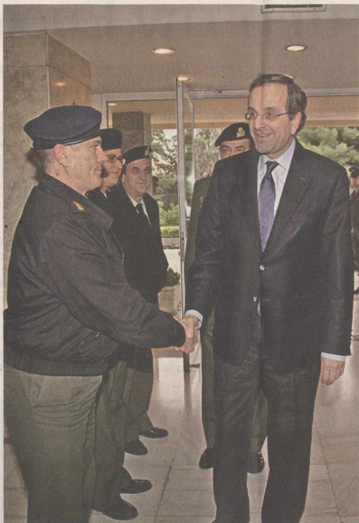
Τους τραυματίες αστυνομικούς των επεισοδίων στην Αθήνα επισκέφθηκε χθες ο πρόεδρος της Ν.Δ. κ. Αντ. Σαμαράς.

Εξίσου ενδιαφέρουσες εσωκομματικά, αλλά και απολύτως ενδοκιμαστικές των αλλαγών που δρομολογούνται στη Συγγρού μετά τη μαζική διαγραφή «σαμαρικών», κατά κύριο λόγο, βουλευτών, είναι η αξιοποίηση στελεχών του φιλελεύθερου μπλόκ, όπως ο κ. Μιλτ. Βαρθιολομήτιος που ορίστηκε τομεάρχη Εμπορίου, ο κ. Κ. Μουσουρούλης που αναβαθμίστηκε σε κοινοβουλευτικό εκπρόσωπο (την άλλη θέση αναλαμβάνει ο Μάριος Σαλμάς), καθώς και η συμμετοχή στελεχών προερχομένων από την «καραμανλική» ομάδα, όπως ο κ. Ευγ. Τουμπάνης, που ανέλαβε τη Γραμματεία Κοινωνικής Συνοχής. Ενδιαφέρον έχουν ακόμη η επαναφορά του πρώην υπουργού Αλ. Κοντού στη θέση του τομεάρχη Περιφερειακής Πολιτικής, αλλά και του προερχομένου από τη «μπ-