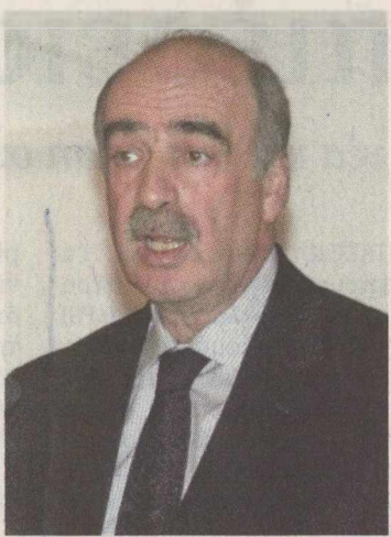
Ο τομεάρχη Εσωτερικών κ. Ευάγγελος Μείμαρakis.

Ως προς τους διαγραφέντες, παρότι για ευνόητους λόγους, προσπαθούν να διατηρήσουν χαμηλούς τους τόνους μετά τη μα-