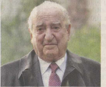
Ο πρώην πρωθυπουργός προτείνει να διορισθούν μόνιμοι υφυπουργοί, πενταετούς θητείας.

« Βαθύ ανασχηματισμό» του κυβερνητικού σκάματος προκειμένου αυτό να καταστεί ολιγομέλές και αποτελεσματικό με τη συμμετοχή πολιτικών και τεχνοκρατών, ζήτησε χθες ο πρώην πρωθυπουργός κ. Κωνσταντίνος Μητσοτάκης. Σε δημόσια παρέμβασή του εκτιμά ότι «η Ελλάδα είναι από καιρό ακυβέρνητη», κατάσταση που δεν μεταβλήθηκε από την κυβέρνηση Παπαδήμου η οποία, όπως σημειώνει ο πρώην πρωθυπουργός, «ασκολείται κατά κύριο λόγο με την αφορμή της άναρχης χρεοκοπίας, παραβλέποντας τη σκληρή καθημερινότητα». «Τα τραγικά γεγονότα της περασμένης Κυριακής, όταν οι κούκουλοφόροι ανενόχλητοι πυρπόλησαν και λεπλάτησαν την πρωτεύουσα, παραβλέποντας το δυστυχώς τη διαπίστωση ότι το κράτος στη χώρα μας έχει καταλυθεί και ότι η δημοκρατία μας δεν λειτουργεί. Και αυτό συνιστά κίνδυνο μεγαλύτερο και από την απειλούμενη χρεοκοπία», προ-