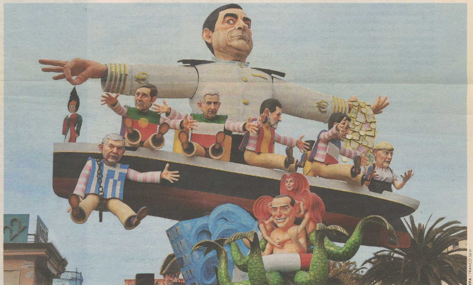
Με το καράβι της Ευρώπης και καπετάνιο τον πρόεδρο της Ευρωπαϊκής Κεντρικής Τράπεζας Μάριο Ντράγκι (πίσω) πλέουν (από αριστερά προς τα δεξιά) ο Πρωθυπουργός της Πορτογαλίας Πέδρο Πάσος Κόελιο, της Ιταλίας Μάριο Μόντι, της Ισπανίας Μαριάνο Ραχόι, ο γάλλος Πρόεδρος

Στην πράξη αυτό σημαίνει πως έως τον Μάρτιο πρέπει να έχουν καθοριστεί τόσο οι υπηρεσιακές μονάδες των υπουργείων που θα καταργηθούν