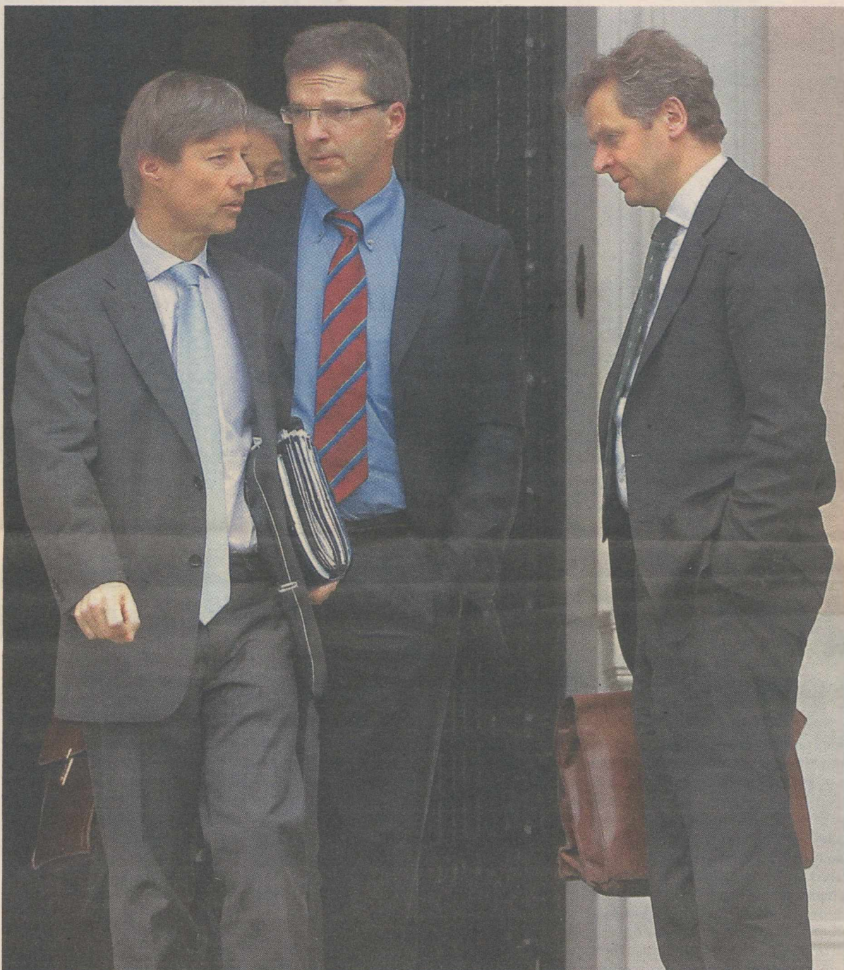
Δύο φορές πέρασαν χθες την πόρτα του Μαξίμου οι εκπρόσωποι της τρόικας. Στο στιγμιότυπο, αποχωρούν από τη μεσημβρινή σύσκεψη. Από αριστερά, ο Ματίας Μορς της ΕΕ, ο Κλάους Μαζούχ της ΕΚΤ και ο Πολ Τόμσεν του ΔΝΤ

Η τρόικα πιέζει για μειώσεις επικουρικών συντάξεων έως και 35%, ενώ η πρόταση Κουτρουμάνη προβλέπει μεσοσταθμική μείωση κατά 15%, κυρίως στα Ταμεία που εμφανίζουν ελλείμματα και ταυτόχρονα καταβάλλουν επικουρικές συντάξεις