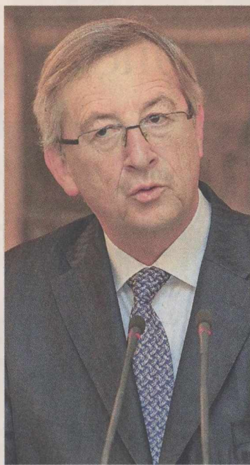
Εκπρόσωπος του Ζαν-Κλοντ Γιουνκέρ ανακοίνωσε την αναβολή της έκτακτης συνεδρίασης του Eurogroup.

Στοιχεία που δείχνουν τη σταδιακή αποκλιμάκωση του ελλείμματος της γενικής κυβέρνησης, καθώς και τη βελτίωση της ανταγωνιστικότητας της ελληνικής οικονομίας, παρέθεσε ο πρωθυπουργός κ. Λ. Παπαδήμος στους ομιλόγους του, κατά τη διάρκεια της πρόσφατης συνόδου κορυφής, σε μια προσπάθεια να μετριάσει τις πιέσεις για τη λήψη νέων σκληρών μέτρων.