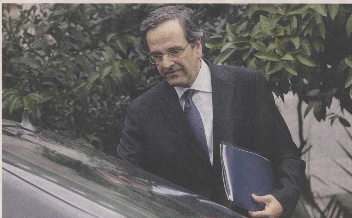
Ο πρόεδρος της Νέας Δημοκρατίας κ. Αντώνης Σαμαράς είχε χθες διαδοχικές συσκέψεις με τους στενούς του συνεργάτες και τα μέλη του οικονομικού κύκλου του κόμματος.

Την ίδια στιγμή αυξάνεται η πίεση της αντιμνημονιακής πρέ-