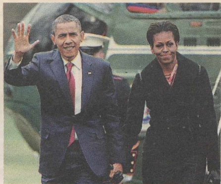
ΡΟΛΟ ΘΕΜΑΤΟΦΥΛΑΚΑ των αξιών του Μπ. Ομπάμα έχει αναλάβει η σύζυγός του Μισέλ. Επαναφέρει αξίες, που σύμβουλοι παραγκωνίζουν

ΕΟΡΤΟΛΟΓΙΟ Πολυεύκτου μάρτυρος, Ευστρατίου οσίου