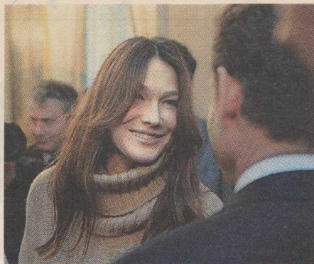
Η ΚΑΡΛΑ ΜΠΡΟΥΝΙ κατηγορείται από γαλλικό περιοδικό για εμπλοκή σε οικονομικό σκάνδαλο. Με εκατομμύρια χρηματοδοτήθηκε ίδρυμά της