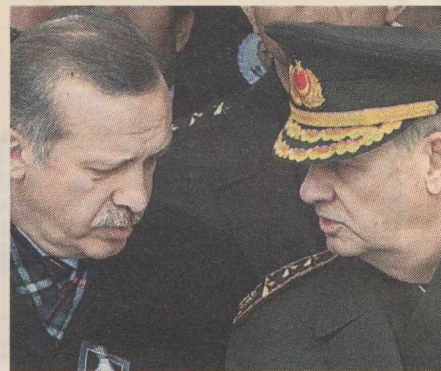
ΤΗΝ ΕΚΠΛΗΞΗ ΤΟΥ για τις κατηγορίες που του αποδίδονται εκφράζει ο πρώην αρχηγός των τουρκικών Ενόπλων Δυνάμεων Ιλκέρ Μπασμπούγ