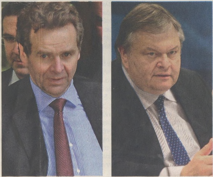
Ο υπουργός Οικονομικών κ. Ευ. Βενιζέλος χαρακτήρισε όχι μόνο κρίσιμες αλλά και δύσκολες τις συζητήσεις με την τρόικα που ξεκίνησαν χθες (φωτό ο εκπρόσωπος του ΔΝΤ Πολ Τόμσεν) και τόνισε ότι θα πρέπει να έχουν ολοκληρωθεί έως το τέλος του Ιανουαρίου προκειμένου να τεθεί σε ισχύ η νέα δανειακή σύμβαση.