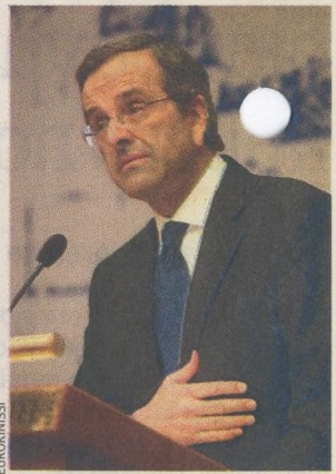
Ο Αντ. Σαμαράς αναχώρησε, χθες, για επίσημη διήμερη επίσκεψη στο Ισραήλ.

Την ίδια στιγμή, ωστόσο, στο εσωτερικό του κόμματος δεν λείπουν οι διαφορετικές προσεγγίσεις σχετικά με τον ρόλο «διαχειριστικό», όπως θέλει η επίσημη Ν.Δ., ή ουσιαστικό, όπως επιμένουν κορυφαία στελέχη της κυβερνήσεως Παπαδήμου. Ενδεικτικά είναι η προχθεσινή, νέα παρέμβαση του αντιπροέδρου του κόμματος και υπουργού Αμυνας Δημ. Αβραμόπουλου (Ελ. Τύπος), με την οποία μεταξύ άλλων τονίζει ότι αυτή η κυβέρνηση έχει αναλάβει μια σημαντικότητα αποστολή, αν και είναι προσδιορισμένη στον χρονικό της βίο, «και δεν είναι ασφαλώς κυβέρνηση της Ν.Δ. ούτε του ΠΑΣΟΚ ούτε του ΛΑΟΣ... είναι μια κυβέρνηση που εμπνέει προσδοκία. Καλούμαστε, λοιπόν, όλοι με υπεύθυνο τρόπο να συμβάλουμε, χωρίς προσκόμματα και δεύτερες σκέψεις, για το καλό της χώρας και μόνο», κατέληξε ο κ. Αβραμόπουλος.