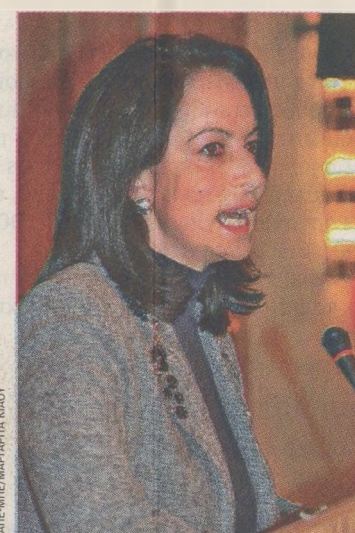
Ποικίλες αντιδράσεις προκάλεσε η παρέμβαση του κ. Κ. Στεφανόπουλου περί επιμήκυνσης του βίου της κυβέρνησης Παπαδήμου. Η κ. Άννα Διαμαντοπούλου τάχθηκε ήδη υπέρ της παράτασης του βίου του υφιστάμενου κυβερνητικού σχήματος.

Από την πλευρά της Ν.Δ. εκπέμπεται δυσφορία για την ανακίνηση του ζητήματος και μεταδίδεται ότι οι εκλογές δεν πρέπει να βραδύνουν.