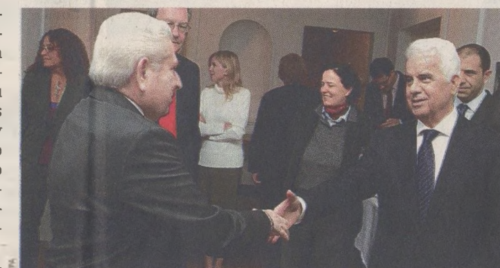
Ο πρόεδρος της Κυπριακής Δημοκρατίας, κ. Δημ. Χριστόφιας, με τον Τουρκοκύπριο ηγέτη, κ. Ντερβίς Ερογλου, κατά τη χθεσινή τους συνάντηση.

Σε ναυαγίο κατέληξε η χθεσινή συνάντηση του προέδρου της Κυπριακής Δημοκρατίας, Δημήτρη Χριστόφια, με τον Τουρκοκύπριο ηγέτη, Ντερβίς Ερογλου, οι οποίοι, στο πλαίσιο των απευθείας εντατικών διαπραγματεύσεων για το Κυπριακό, συζητήσαν το θέμα του περιουσιακού. Ο ίδιος ο κ. Χριστόφιας, αμέσως μετά τη συνάντηση, αναφέρθηκε σε «αποτυχία», λέγοντας ότι πήγε πολύ άσχημα η χθεσινή συζήτηση. Ο Κύπριος πρόεδρος δήλωσε ότι η ελληνοκυπριακή πλευρά συνεχίζει την προσπάθεια για γόνιμη διαπραγμάτευση, ωστόσο η τουρκοκυπριακή πλευρά δεν ανταποκρίνεται. «Είναι αποτυχία η συνάντηση και πρέπει να το πούμε στον κόσμο. Αυτή είναι και η διαπίστωση των Ηνωμένων Εθνών», δήλωσε. Πρόσθεσε, επίσης, ότι στη συνάντηση που έγινε υπό τον γ.γ. του ΟΗΕ, Μπαν Κι Μουν, στον Greentree της Νέας Υόρκης, είχε αποφασισθεί να δημιουργηθεί επιτροπή για το περιουσιακό, το οποίο η ελληνοκυπριακή πλευρά διαρκώς συνδέει με το εδαφικό. «Εμείς δώσαμε και ονόματα για την επιτροπή, είμαστε πανέτοιμοι, έχουμε βρει τα αναγκαία στοιχεία για το περιουσιακό, έχουμε και για το εδαφικό τα στοιχεία μας, αλ-