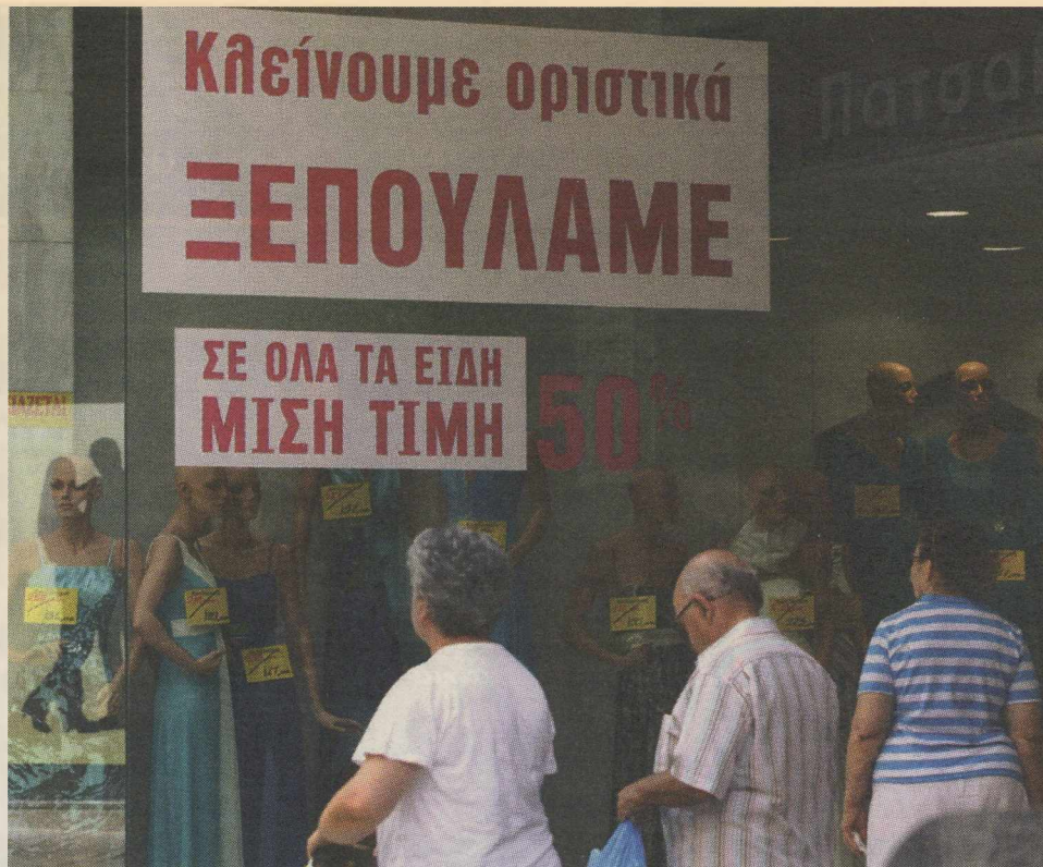
Συνθησιμένη πια εικόνα καταστημάτων στο κέντρο της Αθήνας.

Το αποτέλεσμα των δημοτικών εκλογών του Νοεμβρίου 2010 ήταν ευνοϊκό για το κυβερνών κόμμα. Από πολιτική άποψη η είσοδος στην κρίσιμη φάση των μεταρρυθμίσεων ήταν εφικτή. Αυτό όμως που ακολούθησε ήταν μια περίοδος χαλάρωσης. Η αμηχανία κορυφώθηκε όταν τον Φεβρουάριο 2011