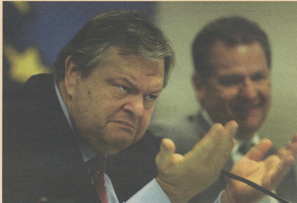
Οι επικεφαλής του οικονομικού επιτελείου, επιλογή του πρώην πρωθυπουργού Γ. Α. Παπανδρέου: ο υπουργός Οικονομικών Ενάγγελος Βενιζέλος μαζί με τον αναπληρωτή υπουργό Παντελή Οικονόμου κατά τη διάρκεια συνέντευξης Τύπου για την παρουσίαση των αποτελεσμάτων της Συνόδου Κορυφής στις Βρυξέλλες για την Ελληνική Οικονομία, 22 Ιουλίου 2011.

Στο πεδίο της αγοράς εργασίας, η τρόικα επέμεινε πάνω σε μια σημαντική αλλαγή: Οι επιχειρησιακές συμβάσεις εργασίας θα έπρεπε να υπερτερούν των κλαδικών όχι ως εξαίρεση αλλά ως κανόνας . Με το καθεστώς του Ν. 1876/90 οι κλαδικές συμβάσεις ήταν το επίκεντρο του συστήματος συλλογικών διαπραγματεύσεων. Οι συμβάσεις σε επίπεδο επιχείρησης ίσχυαν μόνο αν βελτιώναν τις κλαδικές. Κατά την τρόικα το κα-