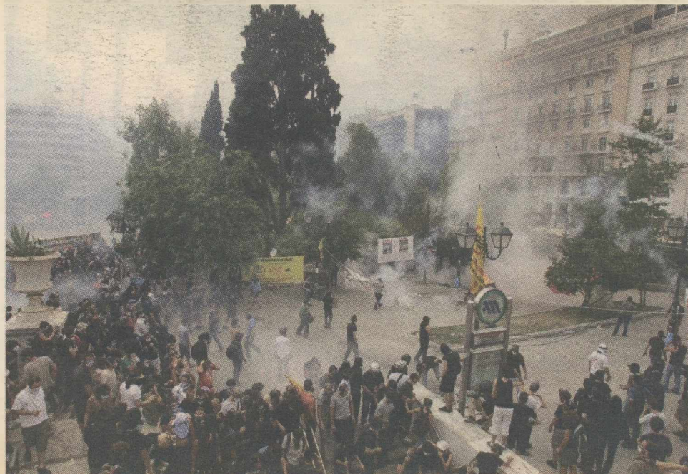
Επεισόδια έξω από τη Βουλή κατά την ψήφιση του Μεσοπρόθεσμου τον Ιούνιο του 2011.

Το θέμα του παρόντος κειμένου είναι τι σήμαινε και πώς εφαρμόστηκε το πρόγραμμα πολιτικής που προσφέρθηκε στην Ελλάδα. Με ενδιαφέρει το Μνημόνιο όπως ήταν και όχι αυτό που θα μπορούσε να είναι αν οι επιλογές της ΕΕ ήταν διαφορετικές. Η Ελλάδα δεν είχε έλεγχο πάνω στις αποφάσεις αυτές. Ακόμη όμως και αν μια διαφορετική πολιτική των βόρειων χωρών της ΕΕ ελάφρυνε το ελληνικό χρέος, τούτο δεν θα αναιρούσε τα θεμελιώδη προβλήματα της χώρας: τη δυσλειτουργικότητα του ελληνικού κρά-