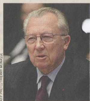
Ο πρώην πρόεδρος της Κομισιόν, Ζακ Ντελόρ.

Αναφερόμενος στον ηγετικό ρόλο που διαδραματίζει η Γερμανία σήμερα στην Ευρώπη, ο Ζακ Ντελόρ τον χαρακτήρισε καταστροφικό, εξαιτίας κυρίως των διαταγών της καγκελάριας Μέρκελ, στην αρχή της κρίσης, το καλοκαίρι του 2011. Ίσως, προσθέτει, η Άγκελα Μέρκελ δεν είχε αντιληφθεί τη σημασία της Ευρώπης για τη Γερμανία «ωστόσο πλέον, η Γερμανίδα καγκελάρια παραδέχεται «όσο καταρρέει το ευρώ και η Γερμανία θα υποστεί σοβαρές απώλειες». Ο Ζακ Ντελόρ αναγνωρίζει ότι η σημερινή θέση της Γερμανίας στην Ευρώπη είναι τέτοια που οι υπόλοιποι Ευρωπαίοι θα πρέπει να δεχτούν να συζητήσουν τις προτάσεις της. Οι γερμανικές προτάσεις, όμως, σύμφωνα με τον πρώην πρόεδρο της Κομισιόν, έρχονται σε αντίθεση με το κοινοτικό πρότυπο, το οποίο μέχρι τώρα συνέβαλε στην πρόοδο της Ευρώπης. Η μέθοδος Μέρκελ για την Ε.Ε., η οποία έχει στόχο τη μετατροπή της Κομισιόν σε μια «τεχνική γραμματεία», δεν μπορεί να έχει θετικό αποτέλεσμα. Οσο για μια νέα συνθήκη που θα διέπει τη λειτουργία της Ε.Ε. και η οποία θα έχει πρωτίστως μια τιμωρητική παράμετρο, όπως προτείνουν οι Γερμανοί, αυτά θα υπονομεύσει το ευρωπαϊκό οικοδόμημα, λέει ο Ντελόρ. Οι Γερμανοί θα πρέπει να καταλάβουν ότι οι άλλες χώρες χρειάζονται χρέος και μέσα για να ενσωματωθούν στην παγκοσμιοποίηση και για να βρουν τη θέση τους σε αυτήν.