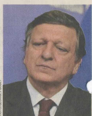
Ο πρόεδρος της Κομισιόν, Ζοζέ Μπαρόζο.

Απαιτείται η αναθεώρηση της Συνθήκης της Λισσαβώνας στις δύο εκ των βασικών εκδοχών.