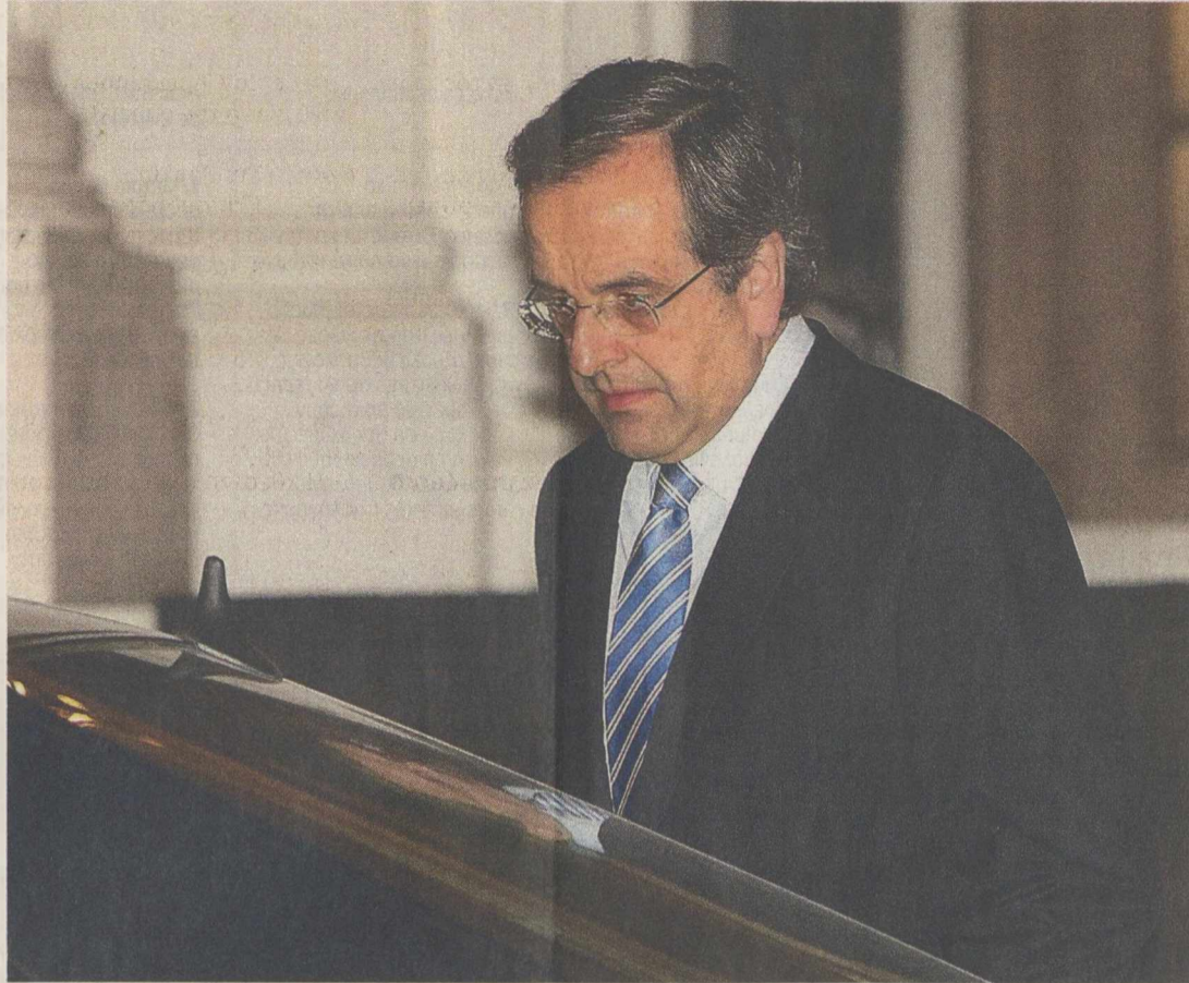
Ο κ. Αντ. Σαμαράς εξερχόμενος του Μεγάρου Μαξίμου, μετά τη συνάντηση που είχε με τον πρωθυπουργό.

Της χθεσινής πρωτοβουλίας προηγήθηκε ένα μακρύ και επίπονο παρασκήνιο, το οποίο ξεκίνησε από το μεσημέρι της Τρίτης, όταν πλέον κατέστη σαφές ότι χωρίς έγγραφη δέσμευση η γερμανική πλευρά δεν θα επέτρεπε την καταβολή της δόσης. Ο κ. Σαμαράς και οι επιτελείς του αναζητήσαν έναν «έντιμο συμβιβασμό», ο οποίος θα ικανοποιούσε την τρέχουσα και το Βερολίνο, χωρίς ταυτόχρονα να ακυρώνει τον πολιτικό λόγο του κ. Σαμαρά. Στις μακρές διαβουλεύσεις που πραγματοποιήθηκαν, σύμφωνα με πληροφορίες, είχαν ενεργό συμμετοχή και οι δύο αντιπρόεδροι της Ν.Δ., ο υπουργός Εξωτερικών κ. Στ. Δήμας και ο υπουργός Άμυνας κ. Δημ. Αβραμόπουλος. Τα δύο κορυφαία στελέχη, αλλά και άλλοι συνεργάτες του κ. Σαμαρά, φέρονται να είχαν επικοινωνίες με παράγοντες των Βρυξελλών και του Βερολίνου προκειμένου να εξασφαλίσουν ότι επρόκειτο να τύχει θετικής ανταπόκρισης η κίνηση Σαμαρά. Όταν κρίθηκε ότι δόθηκε το πράσινο φως, το γραφείο του κ. Σαμαρά απέστειλε την επιστολή, στην οποία ο αρχηγός της Ν.Δ. μεταξύ άλλων σημειώνει ότι «υποστηρίζει πλήρως τους στόχους της δημοσιονομικής προσαρμογής, αναφορικά με την εξέλιξη του ελληνικού κράτους και την αντιστροφή της δυναμικής του χρέους. Επίσης υποστηρίζει (εργαλεία) που ήδη εφαρμόζονται (αν και ανεπιτυχώς), και ειδικότερα την περικοπή των δημοσίων δαπανών, την καταπολέμηση της φοροδιαφυγής, τις διαρθρωτικές μεταρρυθμίσεις, το πρόγραμμα ιδιωτικοποιήσεων και την αξιοποίηση της ανεκμετάλλευτης ακίνητης δημόσιας περιουσίας».