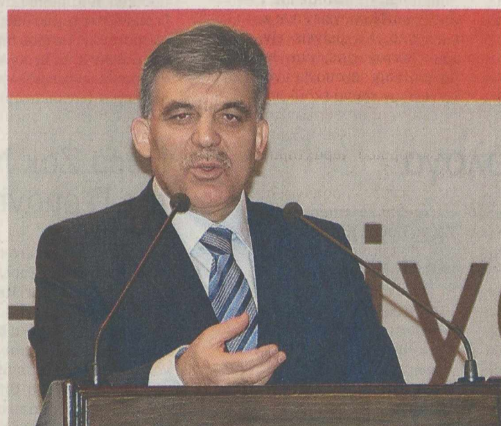
Ο Τούρκος πρόεδρος Αμπντούλγκάι Γκιουλ τόνισε από το Λονδίνο ότι η Ένωση θα χάσει κάθε αξιοπιστία όταν αναλάβει η Κύπρος την προεδρία.

Πρωτοφανείς χαρακτηρισμούς υιοθέτησε ο Τούρκος πρόεδρος, Αμπντούλγκάι Γκιουλ, ο οποίος, από το Λονδίνο όπου πραγματοποιεί επίσημη επίσκεψη, επιτέθηκε σφοδρά στην Κυπριακή Δημοκρατία και την Ε.Ε. Ο κ. Γκιουλ, στη διάρκεια των δηλώσεών του αναφέρθηκε στην ανάλυση της προεδρίας της Ε.Ε. από την Κύπρο κατά το δεύτερο εξάμηνο του 2012. «Η νότια Κύπρος είναι μισό κράτος, που αντιπροσωπεύει μόνον μισό από τον πληθυσμό του νησιού. Τώρα, αυτό το μισό κράτος αναμένεται να αναλάβει την προεδρία της Ε.Ε. Τι σύμπτωση. Ένα μισό κράτος θα αναλάβει την προεδρία μιας μίζερης Ευρώπης», τόνισε. Πρόσθεσε ότι το πάγωμα των κεφαλαίων στην ενταξιακή διαπραγμάτευση της Τουρκίας έχει αντικτυπο στο όνομα και στη φήμη της Ε.Ε. και ότι η Ένωση θα χάσει κάθε αξιοπιστία όταν αναλάβει η Κύπρος την προεδρία. Η προοπτική ανάληψης της προεδρίας της Ε.Ε. από την Κύπρο έχει ενοχλήσει σφόδρα την Αγκυρα, η οποία έχει κατ' επανάληψη εκφράσει τη δυσφορία της, φθάνοντας μέχρι του σημείου να απειλήσει με διακοπή κάθε σχέσης με την Ε.Ε. εφόσον η κυπριακή προεδρία προχωρήσει. Ο κ. Γκιουλ υπέγραψε πλοσάφει, απαντώντας σε ερώτηση εάν κατά τη διάρκεια της