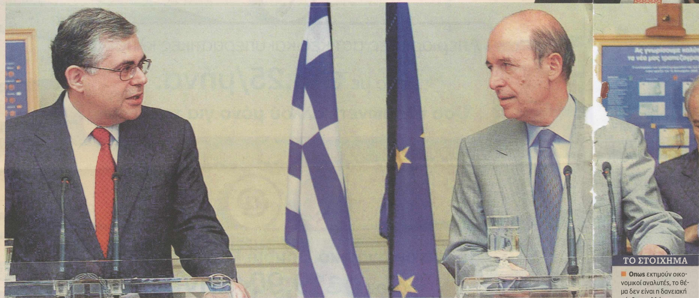
ΤΑ ΟΝΟΜΑΤΑ των Κ. Σημίτη και Λ. Παπαδήμου έχουν «πέσει» στο τραπέζι των συζητήσεων για τους πιθανούς υποψήφιους πρωθυπουργούς.

Ο κ. Σημίτης θέτει θέμα ριζικής αναδιάρθρωσης του σκηνικού, καθώς δεν εμπιστεύεται το υπάρχον πολιτικό σύστημα