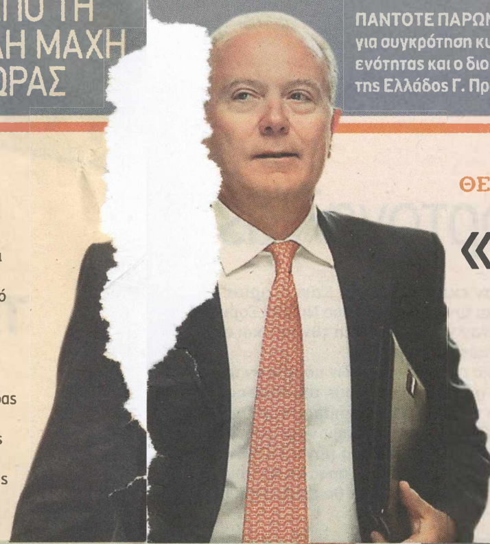
ΠΑΝΤΟΤΕ ΠΑΡΩΝ στις συζητήσεις για συγκρότηση κυβέρνησης εθνικής ενότητας και ο διοικητής της Τράπεζας της Ελλάδος Γ. Προβόπουλος

ΠΡΟΚΕΙΤΑΙ για τον πρωτεργάτη της ένταξης της χώρας στο ευρώ πριν από δέκα χρόνια τον πρώην πρωθυπουργό, Κώστα Σημίτη, τον πρώην αντιπρόεδρο της Ευρωπαϊκής Κεντρικής Τράπεζας, Λουκά Παπαδήμο και τον διοικητή της Τράπεζας της Ελλάδος, Γιώργο Προβόπουλο.