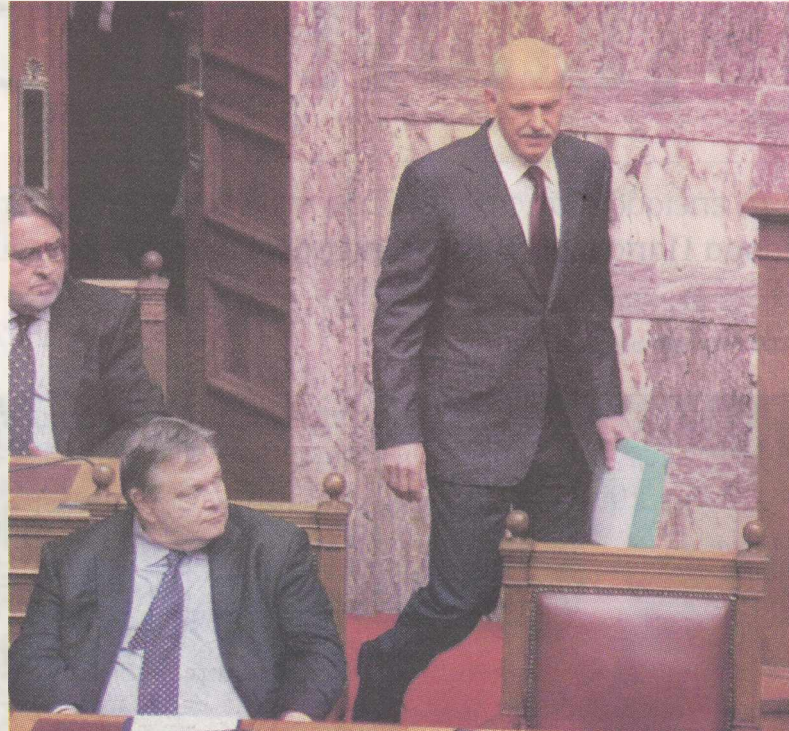
➔ Αν αληθεύουν οι φήμες ότι ο Ευ. Βενιζέλος θα είναι ο νέος πρωθυπουργός, με τη σύμφωνη γνώμη του Γ. Παπανδρέου, τότε θα έχουμε μοντέλο Πούτιν-Μεντβέντεφ σε ελληνική εκδοχή.

Ωστόσο η συμπόρευση έχει κόστος για τον κ. Βενιζέλο. Από τη στιγμή που δέχθηκε να διαχειριστεί το χαρτοφυλάκιο της Οικονομίας ξεκίνησε η συρρίκνωση του προσωπικού πολιτικού κεφαλαίου του. Το πεδίο της οικονομίας ήταν γεμάτο νάρκες κι αυτός, παρά τις δεξιότητες του και τους ελιγμούς που έκανε, δεν μπόρεσε να τις αποφύγει.