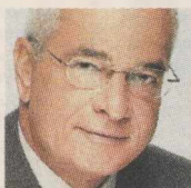
ΤΟΥ Ι. Κ. ΠΡΕΤΕΝΤΕΡΗ

ΠΟΛΥ ΦΟΒΟΥΜΑΙ ότι η κατάσταση κινδυνεύει να τεθεί εκτός ελέγχου. Οχι μόνο λόγω των αντιδράσεων της κοινωνίας ή των συντεχνιών – όπως θέλει το βλέπει ο καθένας... Αλλά επειδή κανείς δεν δείχνει διατεθειμένος ή ικανός να την ελέγξει.