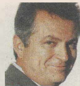
ΤΟΥ ΓΙΩΡΓΟΥ ΧΡ. ΠΑΠΑΧΡΗΣΤΟΥ

ΠΡΑΓΜΑΤΙΚΑ μοιάζει με κακόγουστο αστείο αυτό που συμβαίνει με τα δυο μεγάλα κόμματα ή, για την ακρίβεια, με τους αρχηγούς των δυο μεγάλων κομμάτων, τον Πρωθυπουργό και τον αρχηγό της αξιωματικής αντιπολίτευσης. Η εικόνα είναι επιγραμματικά η εξής: ο ένας είναι αποφασισμένος να παραμείνει στην πρωθυπουργία με τον φανατισμό βεραποστόλου που επιμένει να εκ-