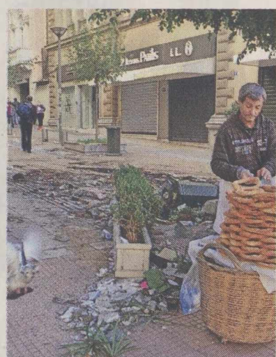
Άρνηση, απελπισία, οργή. Είναι οι πρώτες, φυσικές, αντιδράσεις της ελληνικής κοινωνίας, μιας κοινωνίας σε σοκ.

Η ελληνική κοινωνία δεν ήταν έτοιμη για την κρίση. Όχι μόνο για την οικονομική -ποιος θυμάται τα περί «θωρακισμένης οικονομίας»; - αλλά για την ολοκληρωτική κατάρρευση ενός μοντέλου που λειτουργούσε διογκούμε-