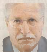
ΤΟΥ Π.Κ. ΙΩΑΚΕΜΙΔΙΑ

Πολύς λόγος γίνεται τελευταία για «τον κίνδυνο εκχώρησης εθνικής κυριαρχίας στις Βρυξέλλες, στην Ευρωπαϊκή Ένωση, στην τρίκα». Σύμφωνα, πρέπει οπωσδήποτε να προστατεύσουμε την εθνική μας κυριαρχία, αλλά από πού και πώς κινδυνεύει; Πάντως, δεν κινδυνεύει από την τρίκα και πολύ περισσότερο δεν κινδυνεύει από την Ευρωπαϊκή Ένωση. Η Ευρωπαϊκή Ένωση συνιστά ένα σύστημα «διαμοιρασμού κυριαρχίας». Οι χώρες που συμμετέχουν σε αυτή έχουν εκχωρήσει (με την Πράξη Προσχώρησης) σημαντικά τμήματα κυριαρχίας προκειμένου να δημιουργήσουν θεσμούς, όργανα και πολιτικές, τελικά ένα νέο πολιτικό σύστημα ικανό να