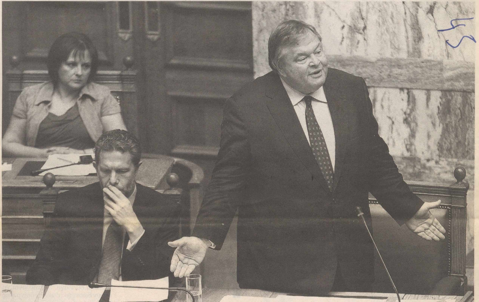
Ο υπουργός Οικονομικών χθες στη Βουλή (δίπλα του ο υπουργός Πολιτισμού Πάυλος Γερούλανος). Ο Ευάγγ. Βενιζέλος δεν απέκλεισε το ενδεχόμενο η ύφεση να συνεχιστεί και το 2012

Την ίδια ώρα η ύφεση, που βαδίζει προς το 5%, αποτελεί μια ακόμη νάρκη, εκτροχιάζοντας τον προϋπολογισμό και θέτοντας εκ των πραγμάτων θέμα είτε αναθεώρησης των στόχων του Μεσοπρόθεσμου Προγράμματος για το έλλειμμα είτε νέων μέτρων, ή συνδυασμό των δύο. Το θέμα θα λυθεί τις επόμενες ημέρες με την τρόικα που έρχεται τη Δευτέρα. Εν τω μεταξύ, το κλίμα παραμένει βαρύ στη Γερμανία, όπου διεξάγεται πραγματικός πόλεμος κατά της συμφωνίας της 21ης Ιουλίου και της ιδέας του ευρωομολόγου. Ανάσα στην Ελλάδα προσφέρουν μόνο κάποιες φωνές, όπως του πρώην καγκελαρίου Χέλμουτ Σμιτ, που επέκρινε την κυβέρνηση Μέρκελ για αδιαφορία απέναντι στην Ελλάδα.