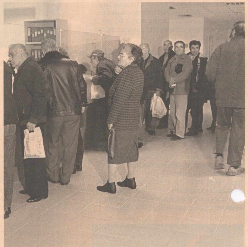
Για να χορηγηθεί το ΕΚΑΣ, τίθεται και πρόσθετη προϋπόθεση να μην υπερβαίνει το ποσό 850 ευρώ το άθροισμα της κύριας και της επικουρικής του τρέχοντος έτους.

• Η δεύτερη αλλαγή αφορά στην προσαύξηση και του εισοδήματος που διαπιστώνεται στο τρέχον έτος χορήγησης του ΕΚΑΣ. Επί παραδείγματι, με τα προ του νόμου κριτήρια για τη χορήγηση του ΕΚΑΣ το