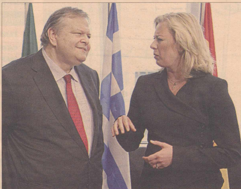
Ο υπουργός Οικονομικών Ευάγγ. Βενιζέλος σε πρόσφατη συνάντησή του με τη Φινλανδή ομόλογό του Ούτα Ουρπιλάινεν

ΘΑ ΕΠΕΝΔΥΘΕΙ Ειδικότερα, και όσον αφορά τη συμφωνία με τη Φινλανδία, σύμφωνα με τα όσα διευκρίνιζαν, χθες, πηγές του υπουργείου Οικονομικών, επί της ουσίας ένα μεγάλο μέρος της φινλανδικής συμμετοχής, που εκτιμάται συνολικά περίπου στο 1,5 δισ. ευρώ, δεν θα είναι άμεσα στη διάθεση της Ελλάδας. Από το νέο δάνειο που θα πάρει η Ελλάδα, κάποιες εκατοντάδες εκατομμύρια ευρώ, τα οποία πάντως δεν δημιουργούν πρόβλημα βιωσιμότητας για την Ελλάδα, θα κατατεθούν σε λογαριασμό του φινλανδικού Δημοσίου. Το ποσό αυτό, το οποίο θα επενδύεται από τη Φινλανδία σε ομόλογα AAA, θα δοθεί στην Ελλάδα με τους τόκους, εφόσον η χώρα πετύχει τους στόχους της στο πλαίσιο του πολυετούς προγράμματος προσαρμογής που συμφωνήθηκε τον Ιούλιο. Εάν η Ελλάδα αποτύχει, το ποσό θα παραμείνει στη Φινλανδία. Με τη συμφωνία, που μένει να εγκριθεί από το Euro Working Group, δηλαδή Eurogroup σε επίπεδο εκπροσώπων των υπουργών Οικονομικών, το οποίο συνεδριάζει εντός της εβδομάδας, παρακάμπτονται οι αντιδράσεις της Φινλανδίας που απαιτούσε