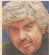
ΤΟΥ ΤΑΚΗ ΘΕΟΔΩΡΟ- ΠΟΥΛΟΥ

Π έρυσι τέτοιες μέρες, υπό τη σκέπη της Παναγίας της Εκατονταπυλιανής στην Πάρο, ο Πρωθυπουργός είχε συμπεράνει ότι «με συλλογικές θυσίες έγιναν τα πρώτα μεγάλα βήματα για να κάνουμε την κρίση ευκαιρία, ώστε να αναμορφώσουμε τη χώρα».