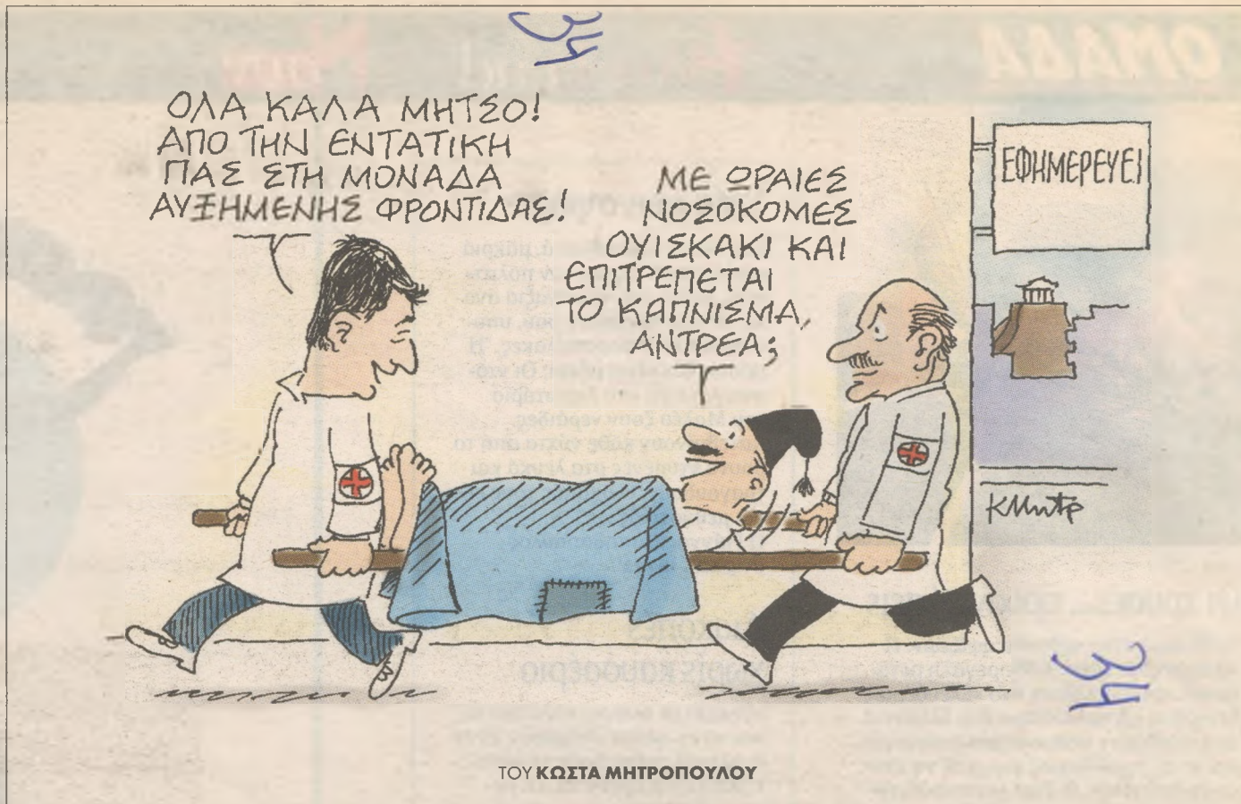
ΤΟΥ ΚΩΣΤΑ ΜΗΤΡΟΠΟΥΛΟΥ

Χ θες η μάχη στο εξωτερικό τελείωσε. Αρχισε όμως ο «πόλεμος» στο εσωτερικό για τον εκουχρονισμό της χώρας με τη μετατροπή της Ελλάδας σε κράτος δικαίου. Όσα σχέδια Μάρσαλ και να δοθούν, όλα θα καθούν στη μαύρη τρύπα αν οι περισσότεροι από τους μισούς Έλληνες ζουν λάθρα, δεν πληρώνουν φόρους και προκαλούν τους υπόλοιπους. Ποτέ η Ελλάδα δεν θα ορθοποδήσει αν οι συντεχνίες με τις φαρδίες κομματικές ομπρέλες ένθεν κακειθεν συνεχίσουν να εκβιάζουν την κοινωνία και να υπονομεύουν κάθε προσπάθεια για ανάπτυξη. Το ΠΑΣΟΚ που κυβερνά δεν πρέπει να ξεχνά ότι η ηγεσία των ταξιτζήδων μπορεί να κρατά γαλάζια σημαία, αλλά οι συνδικαλιστές της ΔΕΗ κρατούν πράσινη. Πρέπει λοιπόν η κυβέρνηση να δείξει την ίδια τόλμη και αποφασιστικότητα και στις δύο περιπτώσεις και σε όλες τις ανάλογες.