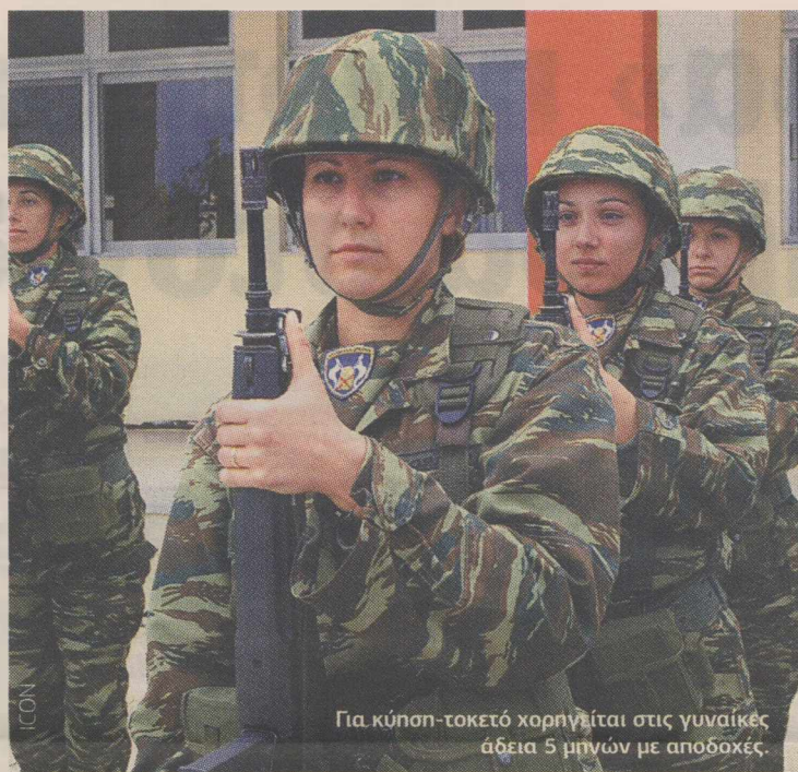
Για κύηση-τοκετό χορηγείται στις γυναίκες άδεια 5 μηνών με αποδοχές.

Σε περίπτωση πολύδυμης κύησης αυξάνεται κατά 1 μήνα για κάθε τέκνο πέραν του ενός, ενώ σε περίπτωση απόκτησης τρίτου τέκνου και άνω η άδεια ανατροφής αυξάνεται κατά 3 μήνες για κάθε τέκνο. Σημειώνεται ότι 9μηνη άδεια ανατροφής τέκνου θα χορηγείται σε γυναίκες