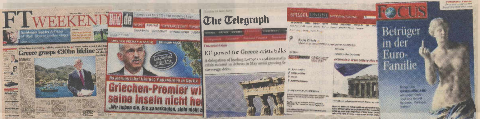
Τη μεγαλύτερη «αδυναμία» στη χώρα μας έδειξαν τα βρετανικά έντυπα με 6.200 δημοσιεύματα και ακολούθησαν τα γερμανικά με 5.600, τα κινεζικά με 5.100, τα γαλλικά με 4.700 και τα αμερικανικά με 3.600. Ξεχωριστή περίπτωση αποτελεί η ταμπλόντ γερμανική εφημερίδα «Bild», με τις λαϊκιστικές προσεγγίσεις. Το πρωτοσέλιδο του γερμανικού «Focus» με την Αφροδίτη είχε προκαλέσει θύελλα αντιδράσεων.

Τη μεγαλύτερη «αδυναμία» στη χώρα μας έδειξαν τα βρετανικά έντυπα (6.200 δημοσιεύματα) και ακολού-