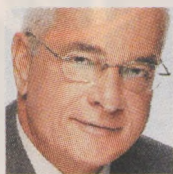
ΤΟΥ Ι. Κ. ΠΡΕΤΕΡΤΕΡΗ

ΕΧΩ μια απορία. Υπάρχει λογικός άνθρωπος ο οποίος θα έλθει για διακοπές στη χώρα που βλέπαμε προχθές στις τηλεοράσεις; Ποιος θα θελήσει να επισκεφθεί μια πόλη η οποία πνίγεται στα δακρυγόνα, στην οποία καταστρέφονται οι πλατείες και πλιατσικολογούνται οι τράπεζες, η οποία θυμίζει Υεμένη ή Λιβύη κι όπου εκκενώνονται τα ξενοδοχεία από τους τουρίστες;