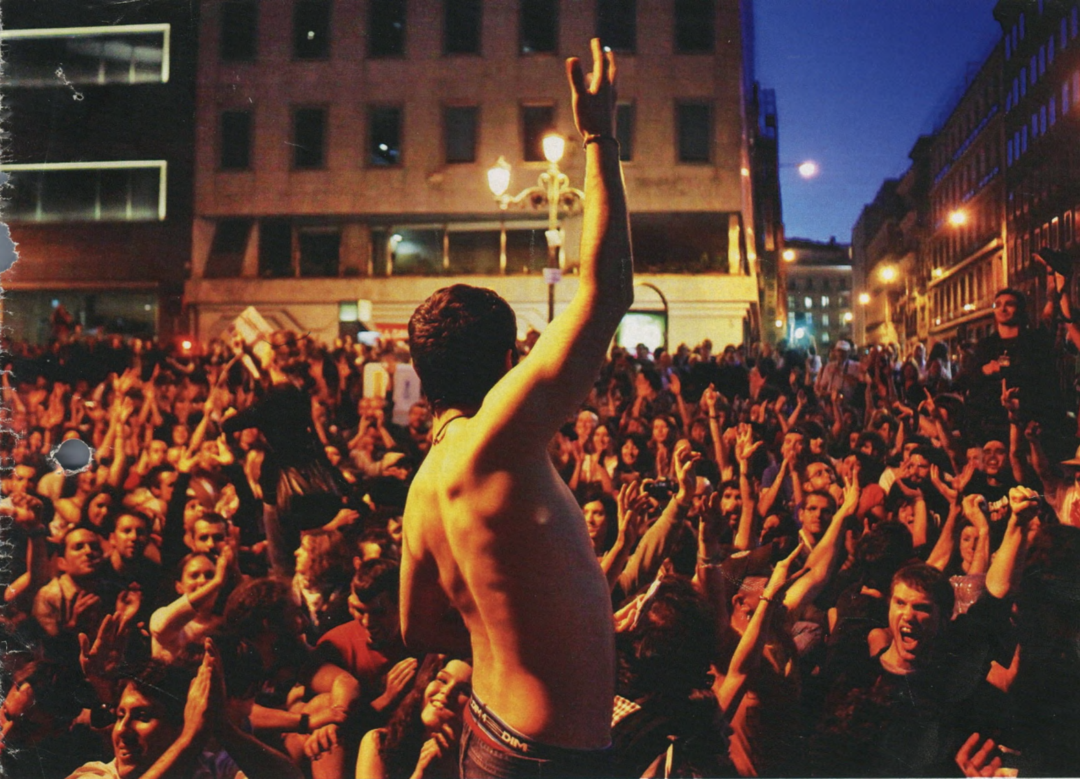
Demonstranten in Madrid: „Wir sind nicht gegen das System, das System ist gegen uns“