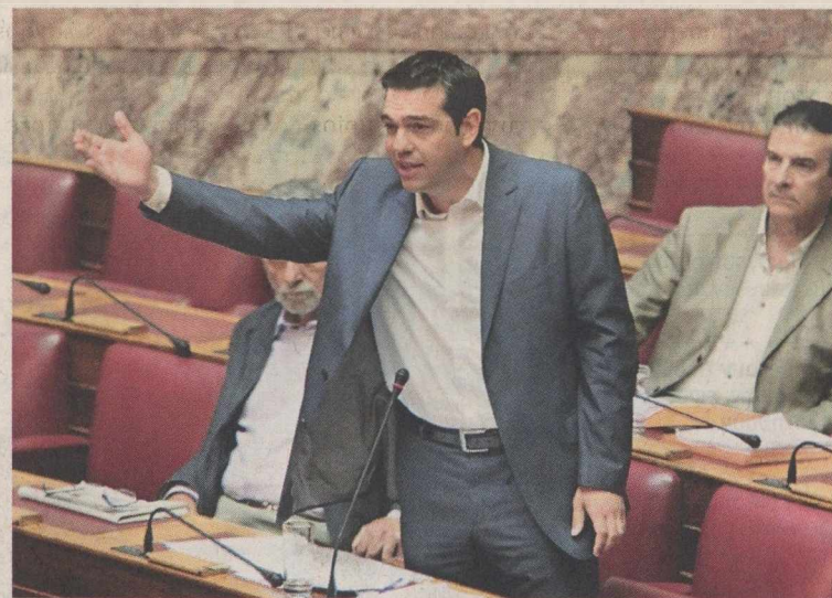
Ο κ. Τσίπρας υποστήριξε ότι ο λαός θέλει αλλαγή πολιτικής.