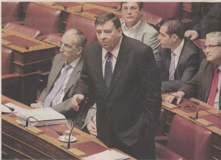
Τριετές πάγωμα στις τιμές των προϊόντων πρότεινε ο κ. Γ. Καρατζαφέρης.

Κλείνοντας, ο πρωθυπουργός ανέφερε ότι εμφανίζονται τα πρώτα σημάδια ανάκαμψης στις εξαγωγές και στον τουρισμό, ζητώντας να μην ισοπεδώνονται επιτυχίες που προέρχονται από θυσίες του λαού.