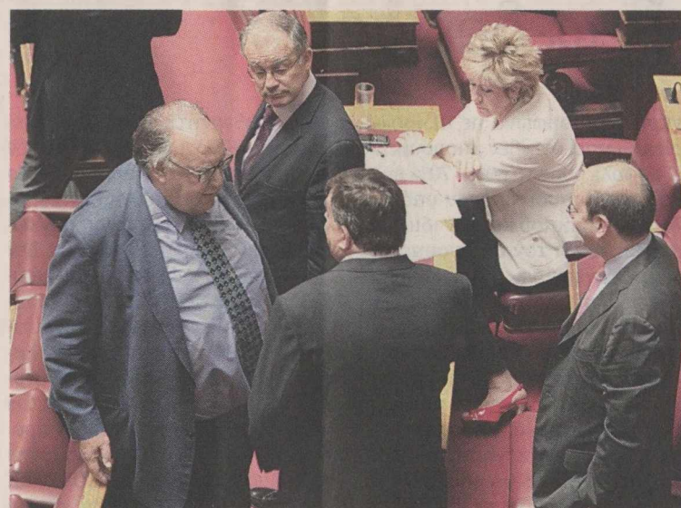
Νέο φραστικό επεισόδιο είχε στη Βουλή ο αντιπρόεδρος της κυβέρνησης κ. Θ. Πάγκαλος με τον κ. Αλ. Τσίπρα.

Σε οξύ -και αυτή τη φορά- τόνο αντάλλαξε ο πρωθυπουργός πολιτικά πυρά με τον πρόεδρο της Κ.Ο. του ΣΥΡΙΖΑ κ. Αλ. Τσίπρα, ο οποίος επαναλαμβάνοντας τη θέση για πρόωρες εκλογές διερωτήθηκε επικαλούμενος τους «Αγανακτισμένους» πολίτες, «τι άλλο πρέπει να γίνει για να καταλάβει ο πρωθυπουργός ότι ο λαός θέλει αλλαγή πολιτικής, δημοκρατία και λαϊκή κυριαρχία, κάτι που δεν