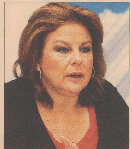
>>> Η υπουργός Εργασίας Λ. Κατσέλη

Αλλαγή του κανόνα για τις προσλήψεις από «1 προς 5» σε «1 προς 10».