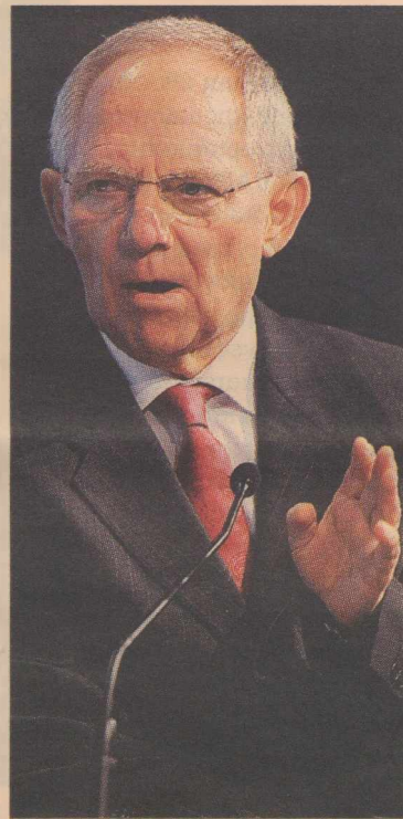
Ο υπουργός Εσωτερικών της Γερμανίας Β. Σόιμπλε

ΣΤΡΟΦΗ ΒΕΡΟΛΙΝΟΥ >>> Το Βερολίνο θα συμφωνήσει, δηλαδή, να δανειστούν κεφάλαια στην Ελλάδα ακόμα και αν οι ιδιώτες κάτοχοι ομολόγων δεν αναλάβουν μέρος του κόστους. Οι συντάκτες σπεύδουν, πάντως, να προσθέσουν ότι κάποιοι Γερμανοί αξιωματούχοι συνεχίζουν να ελπίζουν ότι θα βρεθεί τώρα κάποια βραχυπρόθεσμη λύση και ότι μετά το καλοκαίρι θα υπάρξει μια ευρύτερη συμφωνία, που περι-