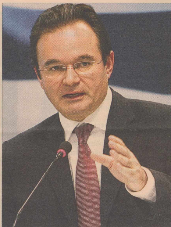
>>> Ο υπουργός Οικονομικών Γ. Παπακωνσταντίνου

ΜΕΙΩΣΗ ΦΠΑ >>> Πάντως, η κυβέρνηση φαίνεται πως έλαβε την έγκριση της τρόικας για τη μείωση των συντελεστών ΦΠΑ, χωρίς όμως να έχει καταλήξει στον ακριβή χρόνο εφαρμογής του μέτρου. Σύμφωνα με τις τελευταίες πληροφορίες το πιθανότερο είναι ότι θα τεθεί σε ισχύ το 2012. Στο τραπέζι των διαπραγματεύσεων έπεσε η πρόταση για μείωση του υψηλού συντελεστή ΦΠΑ από το 23% στο 20% και του χαμηλού συντελεστή από το 13% στο 10% με παράλληλη μετάταξη υπηρεσιών από το χαμηλό στον υψηλό συντελεστή. Το πρακτορείο Reuters μετέδωσε χθες πως Γερμανός αξιωματούχος ο οποίος συμμετέχει στον κυβερνητικό συνασπισμό παραδέχθηκε ότι η τρόικα συναινεί στη μείωση του ΦΠΑ, δηλώνοντας πως «έ-