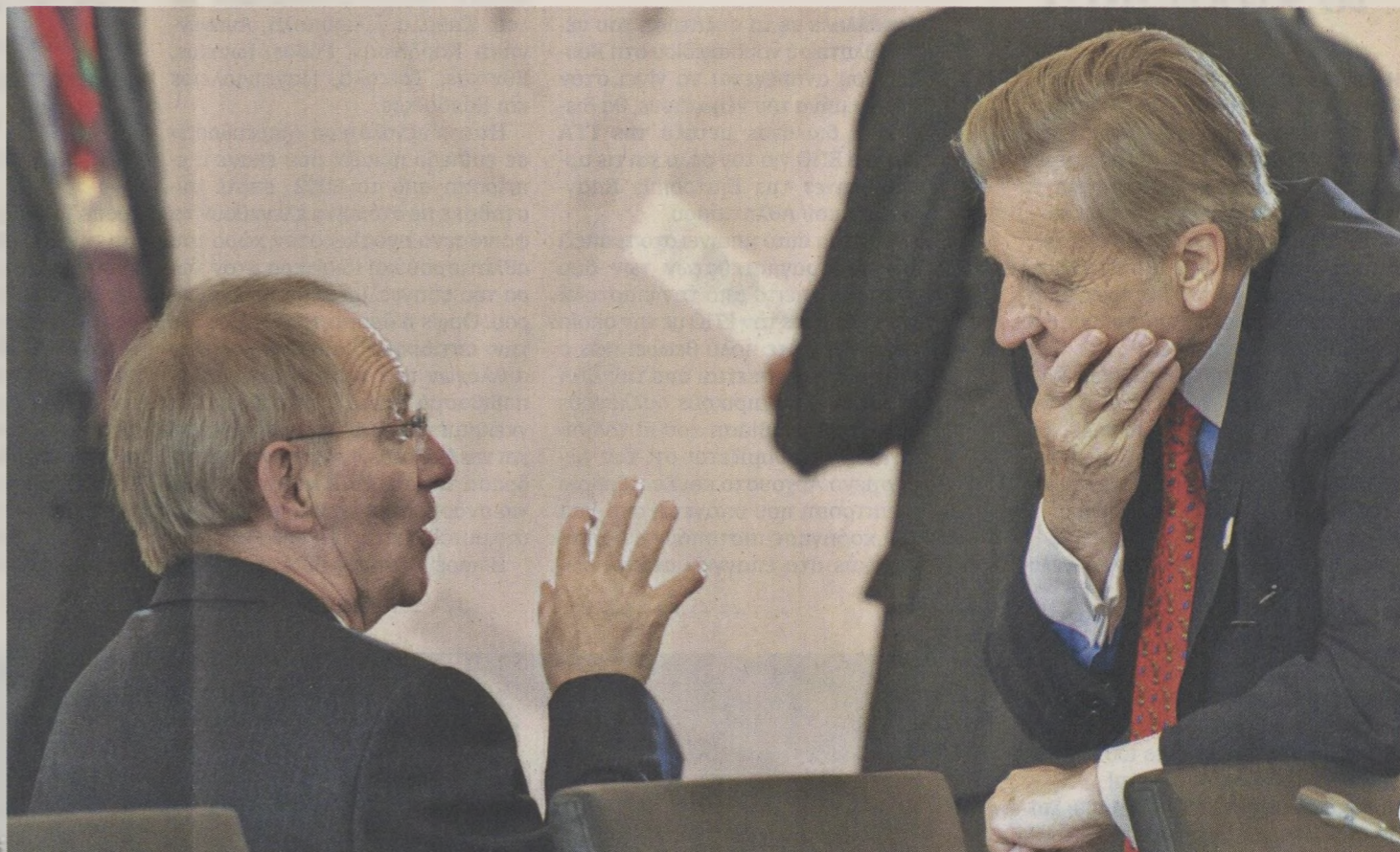
Ο Γερμανός υπουργός Οικονομικών Βόλφγκανγκ Σόιμπλε (αριστερά) και ο Γάλλος πρόεδρος της ΕΚΤ Ζαν-Κλοντ Τρισέ (δεξιά). Η επιμονή του Ντομινίκ Στρος-Καν στις 14 Απριλίου να βρεθεί ξεκάθαρη λύση για την Ελλάδα μέχρι το καλοκαίρι οδήγησε τους δύο άνδρες στη σύγκρουση.

Οι υπόλοιποι παρευρισκόμενοι επίσης έλαβαν θέσεις στα... χαρακώματα, με τους εκπροσώπους της Ολλανδίας και της Φινλανδίας να συντάσσονται με τη