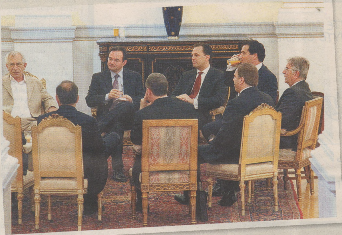
«Δειλοί, μοιραίοι κι άβουλοι αντάμα, προσμένουμε, ίσως, κάποιο θάμα!»