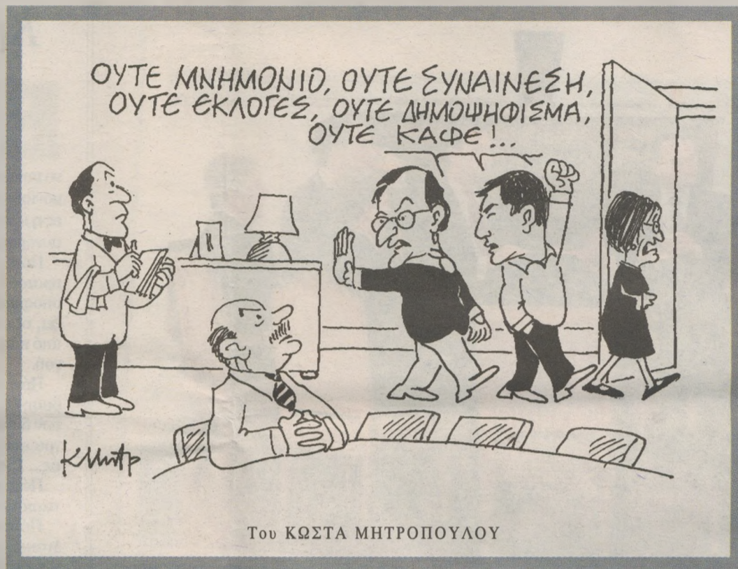
Του ΚΩΣΤΑ ΜΗΤΡΟΠΟΥΛΟΥ

Όταν ο κ. Γ. Παπακωνσταντίνου ολοκλήρωσε την ενημέρωση των πολιτικών αρχηγών αποχώρησε από την αίθουσα και έπεσε πάνω στον κυβερνητικό εκπρόσωπο κ. Γ. Πεταλωτή, στον διευθυντή του γραφείου του προέδρου της ΝΔ καθηγητή κ. Κ. Αρβανιτόπουλο και στον οικονομικό σύμβουλο του κ. Σαμαρά κ. Χρ. Λαζαρίδη, που περίμεναν απέξω. «Το ξέρετε ότι εγώ και