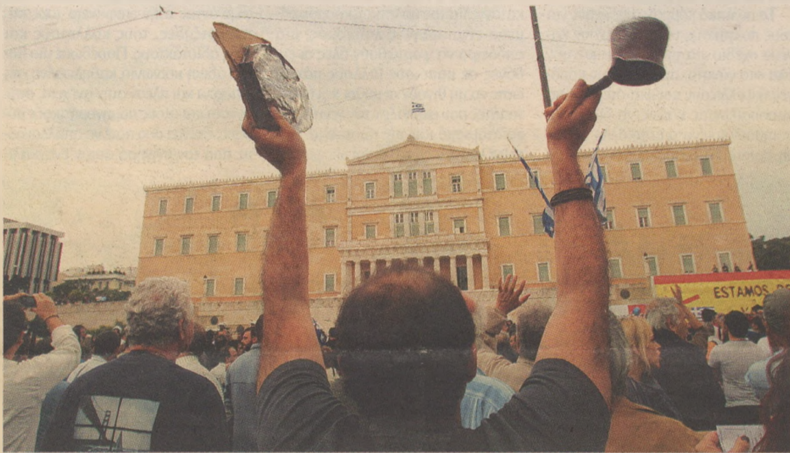
Εκείνο που θα πρέπει να καταλάβουν οι «Αγανακτισμένοι» όπως και οι πολιτικοί είναι ότι πρέπει να δουν τα πράγματα με ευρύτερη οπτική και με προοπτική χρόνου

Ακόμη και αν η κυβέρνηση έσπενδε με πλήρη συναίνεση όλων των κομμάτων να εφαρμόσει όσα εντέλλονται διαδοχικά μνημόνια, προϋπόθεση θα ήταν να μην προκύψουν οικονομικές αναταραχές, νομισματικές κρίσεις, ανατιμήσεις του πετρελαίου κτλ. τα επόμενα 15 χρόνια. Οι αναταραχές αυτές θα απορρυθμίσουν τον μηχανισμό τακτοποίησης του χρέους, σε όσες θυσίες και αν έχουμε υποβληθεί. Χρειάζεται επομένως λύση που δεν θα ακρωθεί εύκολα από τις απρόβλεπτες διεθνείς εξελίξεις. Ποια είναι αυτή; Η αναδιάρθρωση του χρέους τώρα αμέσως. Γιατί; Διότι με την πάροδο του χρόνου το χρέος προς τους ιδιώτες οφειλέτες (κυρίως τις τράπεζες εσωτερικού και εξωτερικού) μετατρέπεται σε χρέος προς την ΕΕ, την