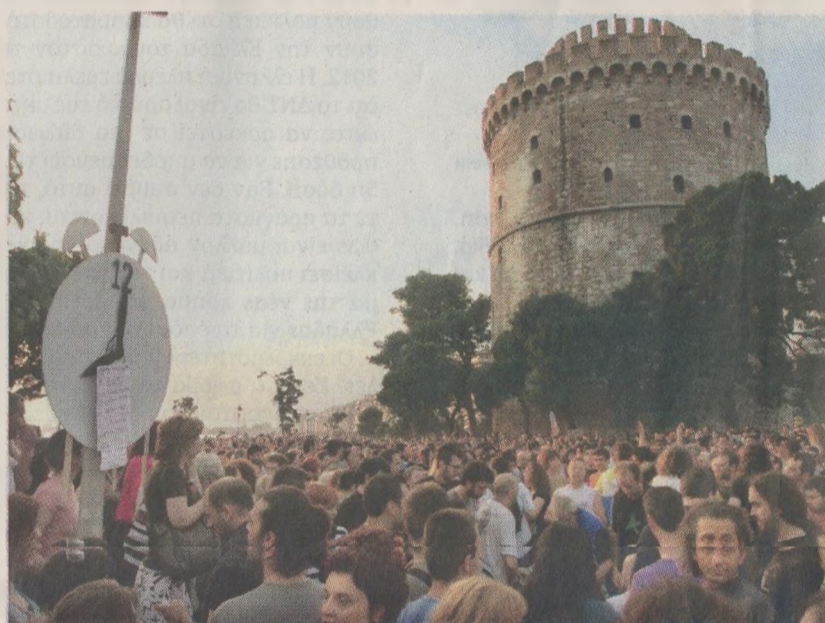
Ένταση και πολλές κόσμος παρατηρήθηκε στη συγκέντρωση της Θεσσαλονίκης.

Ενα πανό αναρτημένο στο ίδιο πάντα περίπτερο έφερε την επιγραφή «Δεν είναι πλιθίοι, είναι προδότες». Αυτή ακριβώς η ιαχή, «προδότες, προδότες», καθώς επίσης «κλέφτες, κλέφτες», δονούσαν την ατμόσφαιρα μπροστά από το Κοινοβούλιο λίγο μετά τις 6.30 μ. π. της ίδιας μέρας. Ανοιχτές παλάμες προς τη Βουλή συμπλήρωναν το σκηνικό, σε πρώτη φάση. Ποδηλάτες με τατουάζ, καλοντυ-