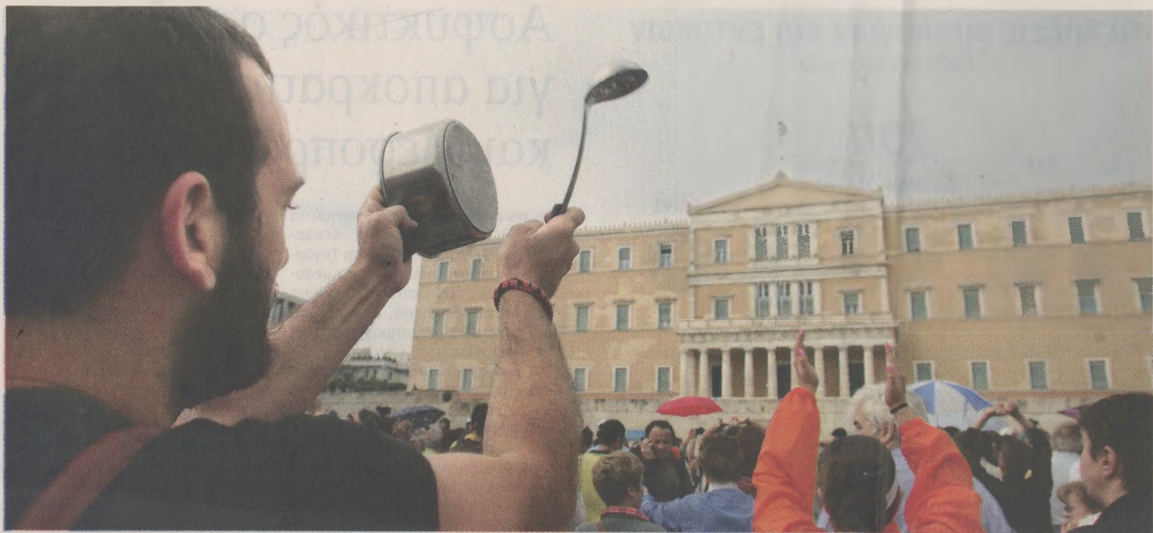
Οι «Αγανακτισμένοι» στην πλατεία Συντάγματος διαδήλωσαν, μοίρασαν φυλλάδια κι έδωσαν νέο ραντεβού την επόμενη ημέρο.