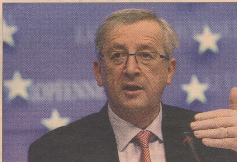
➤ «Πρέπει να αποφασίσουμε με το ΔΝΤ αν στο τέλος του Ιουνίου η δόση των 12 δισ. μπορεί να χορηγηθεί ή όχι», δήλωσε ο Ζ. Κ. Γιούνγκερ

● Η επίτευξη πολιτικής συναίνεσης, αφού ο χρονικός ορίζοντας