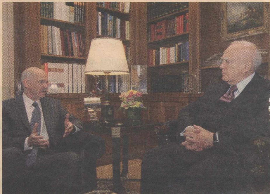
» «Η εναλλακτική περίπτωση από τη δική μας πολιτική είναι αυτό που αντιμετωπίσαμε και πέρυσι. Να πάει η Ελλάδα σε μία εποχή που μπορεί ακόμα και να φτάσει πάλι στο φάσμα της χρεοκοπίας» δήλωσε ο πρωθυπουργός Γ. Παπανδρέου

Η ΔΗΛΩΣΗ » Το πλήρες κείμενο της δήλωσης της κυρίας Δαμανάκη είναι το ακόλουθο: «Η μεγαλύτερη κατάκτηση της μεταπολεμικής Ελλάδας, το ευρώ και η ευρωπαϊκή πορεία της χώρας είναι σε κίνδυνο. Το σενάριο της απομάκρυνσης της Ελλάδας από το ευρώ βρίσκεται πλέον στο τραπέζι καθώς και η μεθόδευσή του. Είμαι υποχρεωμένη να μιλήσω ανοικτά. Έχουμε ιστορική ευθύνη να δούμε το δίλημμα καθαρά: Η συμφωνούμε με τους δανειστές μας σε ένα πρόγραμμα σκληρών θυσιών με αποτελέσματα, αναλαμβάνοντας τις ευθύνες για το παρελθόν μας ή επιστρέφουμε πίσω στη δραχμή. Όλα τα υπόλοιπα είναι δευτερεύοντα στις σημαντικές επιλογές».