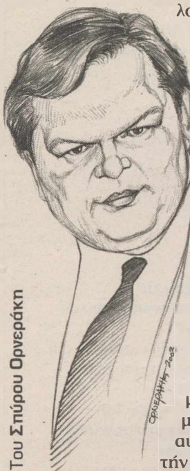
Του Σπύρου Ορφανάκη

ΑΝ Η βιβλική Κιβωτός χρειάστηκε τον Νώε, η Ελλάδα της «εποχής ΔΝΤ» χρειάζεται πολιτικά στελέχη με εμπειρία και μυαλό. Ευφυΐα συναισθηματική δεν διαθέτει ο Βενιζέλος, έχει όμως πλεόνασμα IQ σε εποχή όχι μόνο πολιτικών αλλά και δημοσιονομικών ελλειμμάτων. Δεν τον καλούν λοιπόν στο παιχνίδι μόνο για να μοιραστούν οι ευθύνες - παρ' ότι αυτό ισχύει - αλλά και γιατί περισσεύουν αυτήν την ώρα οι ανάγκες.