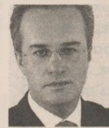
ΤΟΥ ΓΙΑΝΝΗ ΠΟΛΙΤΗ

Εάν πρέπει να αλλάξει τώρα κάτι στο Σύνταγμα μας, είναι η διάταξη που δίνει τη δυνατότητα στον εκάστοτε πρωθυπουργό να σπίνει κάλπες όποτε του κάνει κέφι, είτε για να παρατείνει με τερτίπια την παραμονή του στην εξουσία είτε για να αποδράσει από τα δύσκολα. Ακραίο παράδειγμα ήταν ο Κώστας Καραμανλής. Πήρε εντολή δύο φορές να κυβερνήσει τη χώρα οκτώ χρόνια, αλλά δεν παρέμεινε στο Μέγαρο Μαξίμου ούτε εξή.