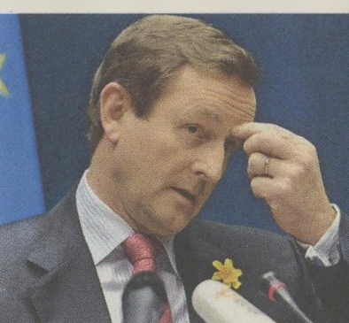
Ο κεντροδεξιός πρωθυπουργός της Ιρλανδίας Εντα Κένι (αριστερά) και ο ηγέτης της συντηρητικής αντιπολίτευσης στην Πορτογαλία, Πέντρο Πάσος Κοέλιο (δεξιά).

Η πλέον χαρακτηριστική περίπτωση είναι ίσως αυτή των «Πραγματικών Φινλανδών», του λαϊκιστικού κόμματος που απειλεί να αλλάξει άρδην τα