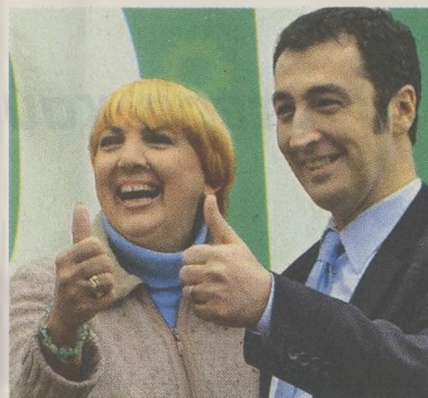
Ο «πραγματικός» Φινλανδός Τίμο Σοϊνί (αριστερά) και οι δύο ηγέτες των Γερμανών Πρασίνων, Κλαούντια Ροθ και Τσεμ Οζντεμίρ (δεξιά).

δεδομένα, τόσο εντός όσο και εκτός Φινλανδίας. Με αφετηρία τον φιλοκλιματικό σχεδόν εθνικισμό, ο ηγέτης του κόμματος, Τίμο Σοϊνί, εμφανίζεται στις δημοσκοπήσεις να διεκδικεί ακόμη και την πρώτη θέση στις βουλευτικές εκλογές της 17ης Απριλίου. Ακόμη και αν δεν επιβεβαιωθεί αυτό το σενάριο, όμως, ο κ. Σοϊνί έχει δηλώσει σε όλους τους τόνους πως δεν θα συμμετάσχει σε κυβέρνηση συνασπισμού, η οποία θα ήπάρσχε εγγυήσεις ή δάνεια στις δοκιμαζόμενες χώρες της ευρωπαϊκής περιφέρειας. «Αν ο Σοϊνί γίνει πρωθυπουργός μετά τον Απρίλιο, τότε η Φινλανδία ενδεχομένως και να μετατραπεί σε Σλοβακία του Βορρά, υπό την έννοια ότι, αν και μέλος της Ευρωζώνης, δεν θα υποστηρίξει κεφαλαιακά άλλα κράτη-μέλη που αντιμετωπίζουν πρόβλημα», σημείωνε αυτήν την εβδομάδα αρθρογράφος της μεγάλης φινλανδικής εφημερίδας Helsingin Sanomat.