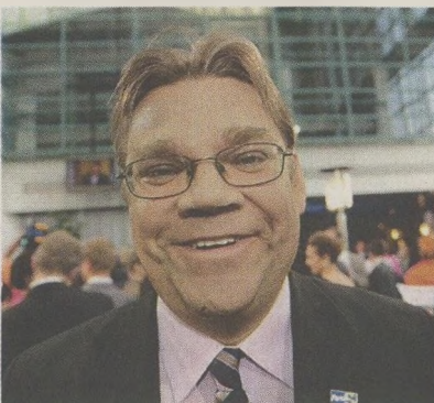
Ο «πραγματικός» Φινλανδός Τίμο Σοϊνί (αριστερά) και οι δύο ηγέτες των Γερμανών Πρασίνων, Κλαούντια Ροθ και Τσεμ Οζντεμίρ (δεξιά).