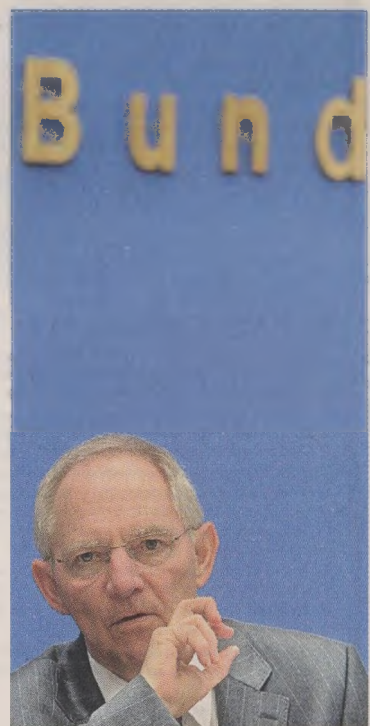
Ο υπουργός Οικονομικών της Γερμανίας, κ. Β. Σόιμπλε.

Παράλληλα, ο κ. Χ. Ζέεκοβερ, πρωθυπουργός της Βαυαρίας και στέλεχος των Χριστιανοκοινωνιστών -εταίρων της κ. Μέρκελ στην κυβέρνηση- έστειλε αυστηρή επι-