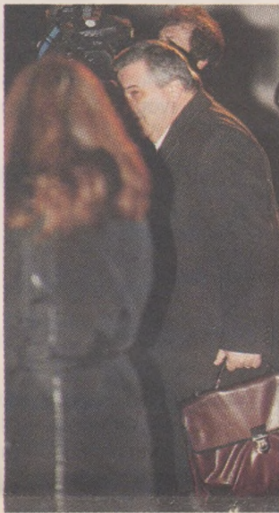
Της νύχτας τα καμώματα...

Ο Γιώργος Παπανδρέου χαρακτήρισε «κρίσιμη τη μάχη μέχρι τις 25 Μαρτίου», αλλά πρόσθεσε ότι «η 25η Μαρτίου δεν είναι το τέλος του κόσμου», γεγονός που αποτυπώνει την απαισιοδοξία που επικρατεί στην Αθήνα. Γι' αυτό και ο ίδιος τόνισε με έμφαση ότι οι αποφάσεις της επικείμενης συνόδου κορυφής είναι κρίσιμες όχι μόνο για την Ελλάδα και τις άλλες χώρες που βρίσκονται σε θέση αδυναμίας, αλλά και για το σύνολο της ευρωζώνης. Και είναι χαρακτηριστικό ότι προσπάθησε να προειδοποιήσει τους Ευρωπαίους ομολόγους του ότι οι αξιολογήσεις των διεθνών οίκων, όπως η χρεοσινή