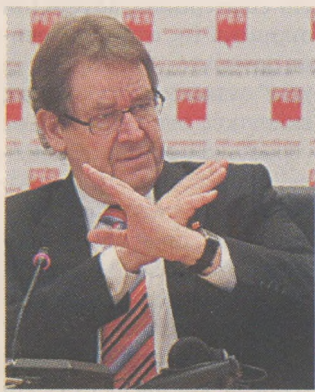
Ο Ράσμουσεν λέει ότι τα επιτόκια ήταν πολύ υψηλά. Όταν το έλεγαν άλλοι...

Ενήμερος, προφανώς, εκ των προτέρων για την επερχό-